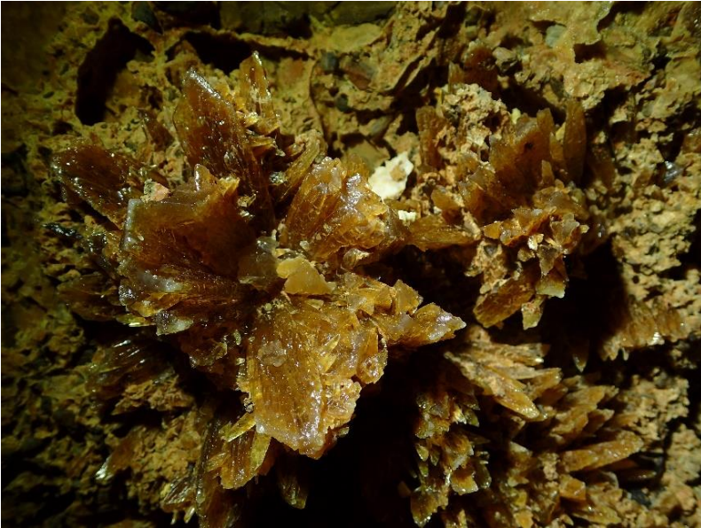
Részlet a Laci-zsombolyból