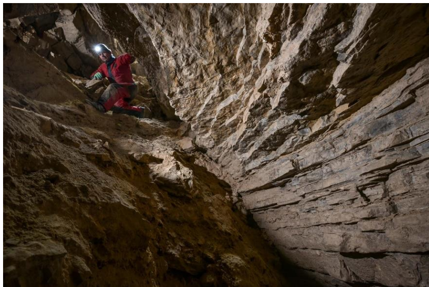
Rezi 1 (R1) – barlang

A barlang jelenlegi állapotában élményszerű bemutatót nyújt ismeretanyaguk, tapasztalati élményeik gyarapítása céljából a környéken túrázó felnőtteknek és gyerekeknek egyaránt, ennek fontossága a környék látnivalóinak (pl. Rezi vár, nyári gyermektáborok stb.) éves szinten nagy létszámú látogatottságában nyilvánul meg.