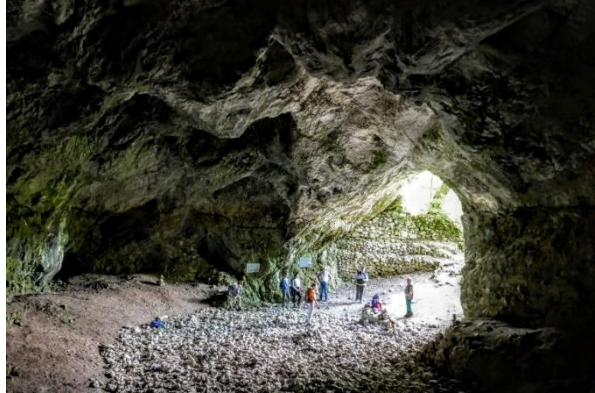
A résztvevők egy csoportja a Szeleta-barlangban

Innen végig mentünk a Forrás-völgyön, útközben megnézve a pataokban a recens édesvízi mészkő kiválásokat. Magyarázat hangzott el erről a kőzettípusról. A fantasztikus, több százéves bükkfa törzsek mellett elhaladva megismerkedtünk a különböző dolina típusokkal, és hazánk legszebb kollapsz dolinájába, az Udvarkő mélyére mentünk le. Innen toronyiránt haladva a hegyoldalban a felszíni karros oldási formákkal (gyökérrak, rácskarr, rillen) ismerkedtünk, majd külön engedélyünk birtokában bejártuk az Udvarkő 1. sz., lezárt barlangot, szintén saját világító eszközeinkkel. Megcsodáltuk a cseppköveket, megnéztük az ásatási helyszíneket, a csontmaradványokat.