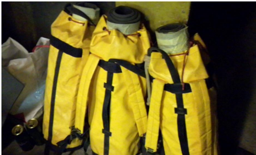
Kép: Bebagelt palackok

Végezetül szeretném mindenkinek megköszönni, aki ebben a két és fél évben segített nekünk. Meg sem próbálom felsorolni a neveket annyian voltunk. És legfőképpen köszönjük a Plecotus barlangkutatóinak a szíveslátást és a türelmet, amivel fogadtak bennünket.