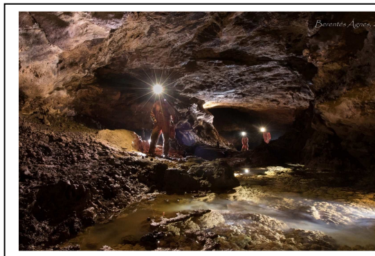
Részlet a Bogos-barlang mélyzónájából

A Bogós-barlangba szervezett két (3–3 napos) bivak során a -250 m alatti mélyzóna hat kérdőjelét sikerült tisztázni, ám ezek csak szerényebb eredményeket hoztak. Így a K-i végpontot jelentő Para-perem-terem végül zsákutcának bizonyult, zárult a Zuhanyzós-akna előtti két kis akna is, míg a Névtelen-akna K-i ablaka már ismert járatra torkollott rá. Az ezzel szemközti ablak mögött viszont egy kis akna és alatta 30 m hosszban járható szűk meander, a Briónak elnevezett oldalág aknája alatt pedig egy újabb tó