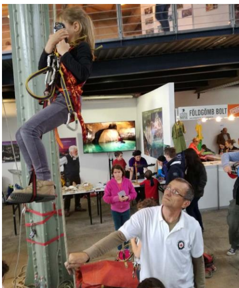
Az MKBT standjai

Társulatunk ez alkalommal is kiadványokkal és a rendezvényeinken történő díjmentes részvétellel szponzorálta a pályázatot.