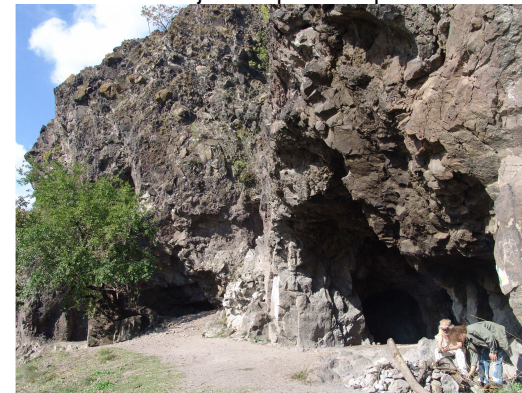
A Remete-barlang

Vasárnap reggel Törökmezőre mentünk, mert innen lett volna a legegyszerűbb eljutni a Nagymaros és Zebegény között a Duna felőli meredek oldalban található Remete-barlanghoz. Sajnos a megcélzott parkolóhoz lezárták az utat az autók előtt, így nagyot kerülve Nagymaros felől közelítettük meg a helyszínt. Talán az utolsó igazi, majdnem nyári meleg napot fogtuk ki, amint róttuk a kilométereket a véget nem érő hegyoldalban.