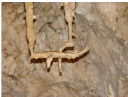
Antro del Corchia