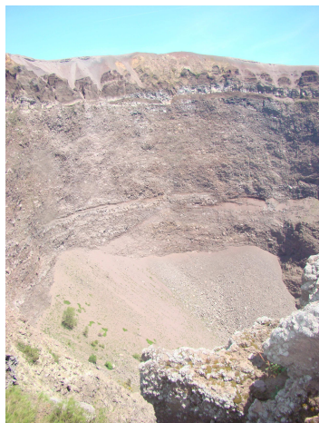
A Vezúv 700 m átmérőjű krátere

Következő nap a Castellana-barlangba mentünk. A hatalmas beszakadás alján nyíló járatok szebbnél-szebb képződményeket rejtettek, mégis az utolsó terem volt az, ahol a hófehér képződmények tömege és formája mindenkit elvarázsolt. Sajnos ünnepnap lévén, folyamatosan jöttek a százas létszámú csoportok, így sok gyönyörködésre nem maradt idő. Innen mintegy 300 km-t tettünk meg a tengerpart mentén, s mikor már majdnem elértük kempingünket, akkor egy defekt kissé átalakította a következő napi programunkat. A Stiffe-barlang helyett a gumishoz kellett menni, utána