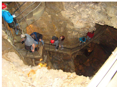
Grotte del Vento

sabban található művelt teraszra, miközben szavunk mind a látványtól, mind a kocsikat vezető srácok teljesítményétől elállt. Rövid tájékoztatást kaptunk a kitermelésről, szállításról, majd lent a múzeumban láthattunk szobrokat is. Másnap a Grotte del Vento (Szél-barlang) szerepelt a programban. Itt a három órás nagy túra során képet kaptunk arról, hogyan lehet kiépíteni az idegenforgalom számára egy zombolyt, végigjártuk a cseppköves szakaszt, illetve az alsó aktív járatba is eljutottunk. Délután Pisa-t kerestük fel, ahol a carrarai márványból készült építményeket, köztük a híres Ferde tornyot néztük meg.