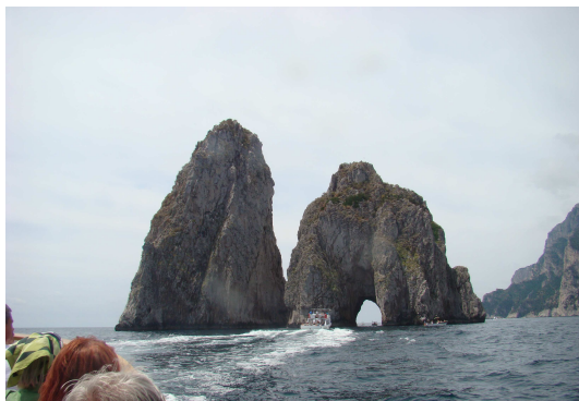
Capri szigete körüli hajóúton

lámzás és a látogatótömeg a kelleténél na-gyobb volt, így sok időt nem tölthettünk a barlangban, de a látvány így is megérte. És a színe... az valóban azúrkék! Utána még elvegyülhettünk a tömegben, csavaroghattunk a fehér falú házak közötti sikátorokban, majd visszahajóztunk Nápolyba.