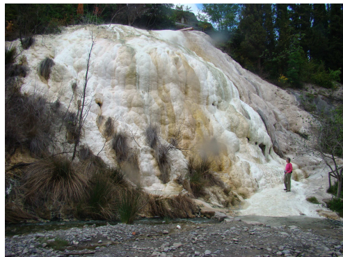
Fosso bianco mésztufadombja

Utunk következő állomása Róma volt, de útközben ismét geológiai látnivalókat kerestünk fel. Elsőként Terme San Giovanni közelében egy látványos, nagy méretű forráshátra másztunk fel, melynek lábánál kénes forrás fakad, majd több felszíni kibúvást láttunk, ahol kénes víz bugyborékol fel. Innen Bagni San Filippo következett, ahol az egerszalóki mésztufadombhoz hasonló jelenséget láthattunk, csak jóval nagyobb méretűt, ez a Fosso bianco. Jóllehet a Világörökséggé nyilvánított látványosságnál táblák tiltják a fürdést, a helyiek társaságában kellemes perceket töltöttünk a melegvizet