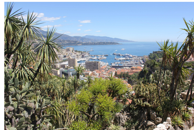
Kilátás a monacoi botanikus kertből

Égész napos utazás után értünk a Riviérára, ahol Antibes tengerpartján ázhattunk meg, de kárpótol minket a másnapi monacói kánikula. Mint kiderült, aznap Forma-1-es időmérő edzést tartottak, ezért azonnal kiebrudaltak a városból, és csak gyalog tudtuk bevenni, mint a Grimaldik egykori őse, aki ferences szerzetesnek öltözve foglalta el a várost. Első programpontunk a