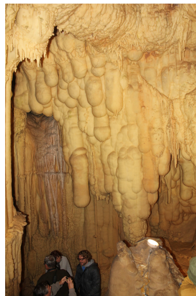
Kugli-cseppkövek a Toirano-barlangban

egyúttal barlang és múzeum is fogadta a látogatókat. A barlang Monacóval ellentétben egyáltalán nem kicsi, hanem cseppkövekkel zsúfolt termek és keskeny folyosók váltakoznak, és a szintkülönbség sem csekély.