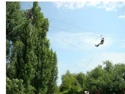
Írány a kötélpályán a Balaton

A verseny díjazásának és a Barlangnap megrendezésének támogatói: