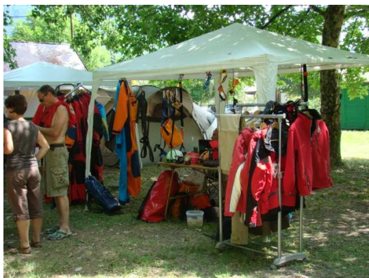
A felszerelés-árusítók standja

Az ország minden tájáról érkező kutatók és érdeklődők a Keszthelyi-hegység és a Tapolcai-medence legnagyobb és legszebb barlangjait járhatták be. 10 barlangban összesen 443 leszállás történt. A túrák vezetésében, túravezetőként és segítőként 31 fő vett részt. A legtapasztaltabb kutatók eljuthattak a közelmúltban feltárt Kessler Hubert-barlangba is, amely 204 méteres (nem hivatalos) mélységével a Dunántúl legmélyebb barlangja címért vetekszik. A tapolcai Kincses-gödörben a túrázók vetített előadások során a tapolcai barlangkutatás múltjával és eddigi eredményeivel ismerkedhettek meg.