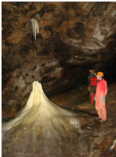
Részlet a Lupberg-barlangból

Egy félnapos látogatást tettünk Hunasban, ahol egy bányászat során feltárt barlangból sok értékes őslénytani lelet, illetve egy neandervölgyi emberfog is előkerült. Az ásatás vezetője fogadta csoportunkat és ismertetett meg az eredményekkel, illetve a helyszínnel, majd sörrrel, üdítővel, péksüteménnyel is megvendégelt. Délután két csoport az Alfelder Windloch-ot kereste fel, amelynek szűkületeiben jól megmászattak bennünket, sőt elnökünk már a bejárati szűkületnél feladta a bejutást. A túra után viszont ismét jóféle pálinka és rágcsálnivalók kerültek elő a vezetőik kosarából. Csoportunkból hárman ezen a délutánon a 45 méter mély Breiten-