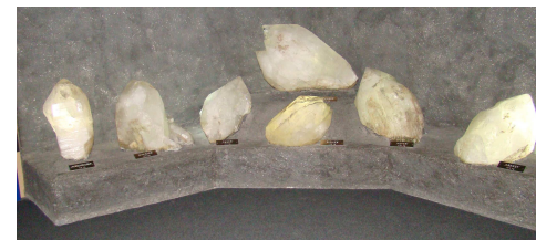
Óriási hegyi kristályok a Természet Házában, a legnagyobb több mint 600 kg

Salzburgból a barrangnap helyszínére, Obertraunba utaztunk, ám útközben is akadt bőven látnivaló. Elsőként a hal-leini sóbányát látogattuk meg. Miután mindenki felöltötte a hajdani sóbányászok fehér munkaruháját, kisvonatra szálltunk, és azzal haladtunk a hegy belsejébe. A 70 perces látogatás során hajóra is ültünk egy sótvon, miközben a látványosan kivilágított sórétegekben gyönyörködhetünk, majd két igen hosszú csúszdán is lecsúszhattunk. Sőt, fiatal vezetőnk