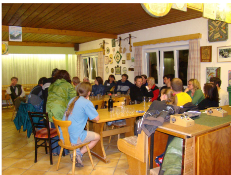
Csoportunk a búcsúesten