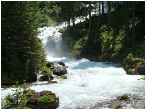
A Waldbach hatalmas víztömege alig 100 méterre a forrástól