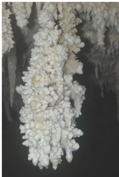
Képződmény a Sonora-barlangban

A kongresszus rengeteg helyszíne és párhuzamosan induló programjai miatt legalább kétfelé kellett volna szakadni. A napközbeni változatos témájú előadások után esti túrákon, koncerteken, fogadásokon tölthettük az időt. Voltunk Texas leghosszabb barlangjában (Honey Creek 30 km), ahová egy mesterséges 50 méter mély kútgyűrű bejáraton egy traktorral eresztettek le, majd húztak ki mindenkit. A kicsit bizarr bejutás után pedig 4–5 órát gyalogoltunk nyakig érő 20 fokos vízben, a gyakorlatilag teljesen képződménymentes járatokban. Viszont voltunk a környék legszebb barlangjában (Sonora), ami agyilag nehezen felfogható képződmény-kavalkádban pompázik, és tényleg a legszebb barlang, ahová valaha eljutottam. És végül elvittek a világ legnagyobb denevérpulációjának kirepülését megnézni a Bracken Cave-hez. Itt 20 millió denevér repül ki szürkületkor a barlangból nagyjából 1 óra alatt, hogy elfogyasszon több tonna rovar, mielőtt újra visszatér szálláshelyére. A komplex élményt a kartávolságnyra elrepülő denevérek látványa, a szárnyaik suhogása, és a hosszú távon nehezen elviselhető szagok terjedése tette teljessé.