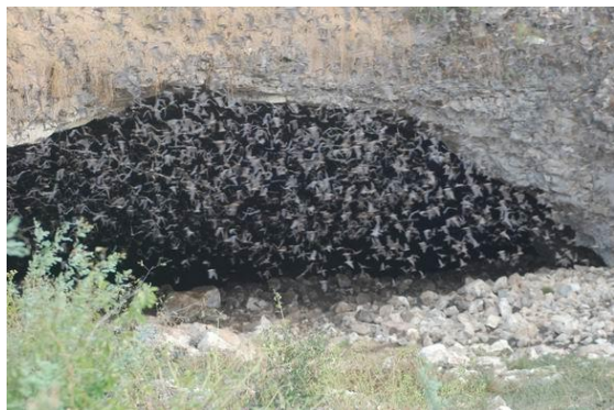
A denevérek kirepülése

A kongresszus után részt vettünk a Mammoth-barlangi terepgyakorlaton, ahol sokkal családiasabb légkörben kaphattunk bepillantást az ott folyó tevékenységekbe. 5 napon keresztül a helyi kutató intézet szervezésében a barlang különböző bejáratain keresztül szálltunk alá, és nézhettük meg a világ leghosszabb barlangjának különböző részeit. Azt azért kihangsúlyoznám, hogy ez a leghosszabb barlang, és nem feltétlen a legnagyobb, mivel egy váloga-