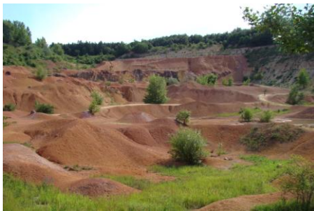
A felhagyott bauxitbánya részlete

Utolsó napra is maradt még bőven program. Utunkat Oroszlány felé folytatva először Majkpusztán álltunk meg, ahol a némasági fogadalmat tett kamalduli rend remeteségének épületegyüttesét tekintettük meg. A később Esterházy vadász-kastélyá alakított épületben ma múzeum látható, az egyszemélyes remetelakok egyike a szerzetesek korának megfelelően van berendezve, a többiben korszerű szállás kapható.