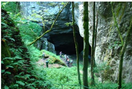
Csoportunk a Sziliceijégbarlangnál

Délután még programon kívül megnéz-hettük a szalmacseppkőveiről nevezetes Gom-baszögi-barlangot, majd ismét felmentünk a Sziliceifennsíkra, ahol el-sétáltunk a Sziliceijégbarlanghoz, amit sokan egyáltalán nem ismertek. Igaz, hogy a barlangba lemenni – engedély hiányában – nem tudtunk, s jeget is alig találtunk, a hatalmas bejárat még így is nagy élményt jelentett. Szerencsére már az időjárás is megjavult, elállt az eső és kisütött a nap, így jól esett a szilicei kocsmá teraszán a sörözés.