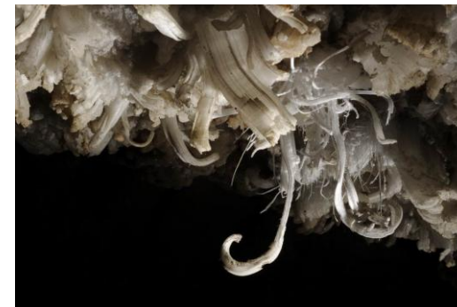
Gipszvirág a Mammoth-barlangban

Az egy hét alatt mindenféle témakörben több mint 300 előadást tartottak, melynek írásos anyagai mind az MKBT-ben, mind pedig a barlangtanban megtalálhatók. Az előadók, és az előadások címeit a következő linken érhetitek el. http://www.ics2009.us/weeklysched.pdf