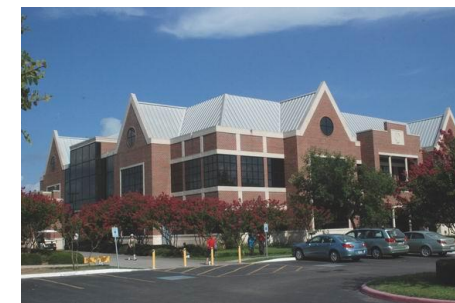
A kongresszus színhelye: a campus