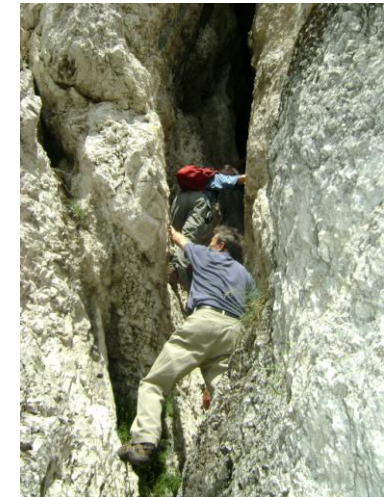
A Kölik-völgyi-barlang bejárati hasadék

Csákvártól búcsút véve Gánt felé indultunk, ahol a Balás Jenő Bauxitbányászati Múzeumot látogattuk meg, utána pedig a földtani tanösvényt