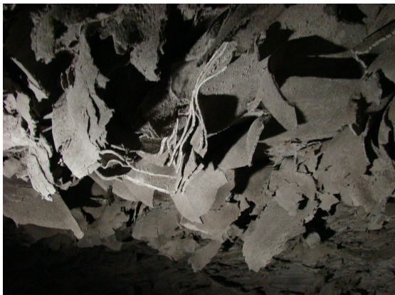
A Barbarossa-barlang gipszrongyai