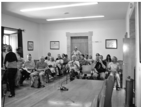
A konferencia résztvevői

A résztvevők két egyetemi kollégiumban voltak elszállásolva. Innen autóbusszal, vagy a helyi kollégák autóiban utazva jutott el a társaság az előadások és egyéb programok színhelyére. A reggeli és a vacsora többnyire a diákszállóban volt, az előadási napokon az egyetemi menzán lehetett ebédelni. Két kirándulás alkalmával a magunkkal vitt hideg ételmezt fogyasztottuk, kétszer pedig a helyiek meghívásának tettünk eleget. A két vendéglátónkat mindenképp illik megemlíteni az igen szíves kíná-