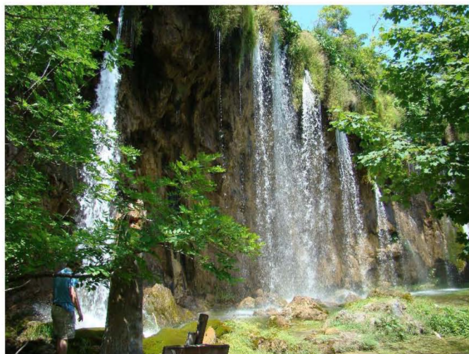
A Plitvicei Nemzeti Park egyik vízesése

Következő napon a Gračac melletti – a Velebit Természeti Park kezelésében levő kétszintes – Cerovačka-barlangokat néztük meg. Az 1290 m hosszú felső a helyi lakosság körében régóta ismert volt, bejárati szakasza állatok és emberek eső elleni menedékeként szolgált. A kb 50 m-rel alacsonyabb nyíló 2680 m hosszú alsó barlangot 1913-ban a Gracac–Split vasútvonal építése során fedezték fel. Látogathatóvá tételük 1951-ben kezdődött meg, 1977-ben a villanyt is bevezették. A bal-káni háborúk idején (1991–1995) zárva volt, és az akkor bekövetkezett jelentős károk elhárítása után 1998 óta ismét látogatható.