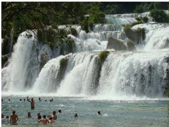
A Krka Nemzeti Park mésztufagátas vízesései

kísért és mérsékelt emelkedő Nagy Paklenica-szurdokban kb. 1 órát gyalogoltunk, majd az északi oldalon szépen kiépített szerpentin-ösvényen további közel 1 órát emelkedtünk a Manita peč nevű, 540 m tfsz. magasságban nyíló barlanghoz. Itt csoportunk külön túrán vett részt a képződménygazdag barlangban. A barlang mindössze 175 m hosszú és egyetlen nagy csarnokból áll, amit azonban a meglepően változatos színű és formakincsű, nagyméretű cseppkőképződmények három teremmé osztanak. A 20. sz. eleje óta ismert barlangot 1937-ben tették járhatóvá a környék turistaútjainak kiépítésével együtt, amikor új, mesterséges bejáratot is nyitottak. 1991 óta van aggregátoros villanyvilágítás, amit éppen ottlétünkönk váltottak ill. egészítették ki napkollektoros áramfejlesztéssel.