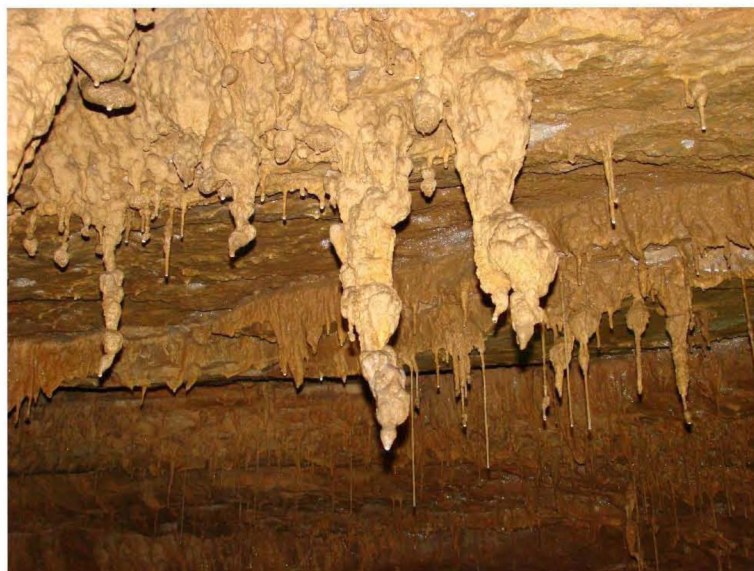
A Vrelo-barlang érdekes mennyezeti képződményei

rörök, szakadéktöbrök, karrok, sziklaoszlopok, fenyőmagasságú monolit sziklatömbök – mind néhány kisebb-nagyobb barlang megnyerték a társaság tetszését, utóbbiakban azok is kiélhették magukat, akik eddig hiányolták az overállos túrákat. Délutánra értünk Zágráb kempingjébe, ahol még maradt néhány óránk városnézésre is.