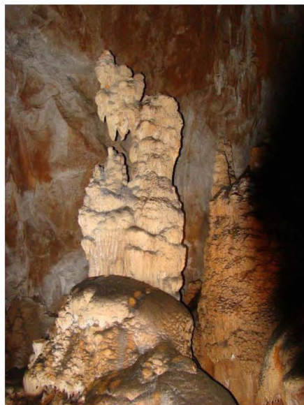
A Manita peč egyik képződménye

Következő napon a Velebit-hegységbe tettünk kirándulást. A Velebit az ország legmagasabb hegysége (2274 m), mely az Adria ÉNy–DK irányú partjával párhuzamosan több mint 100 km hosszan húzódik. Két területe védett: északon az Északi-Velebit Természeti Park, míg délen a két vadregényes szurdokvölgyet és az azokat övező hegyvonulatokat magába foglaló Paklenica Nemzeti Park, mely egyben az UNESCO bioszférezervátuma rangját is elnyerte. Ez utóbbival ismerkedtünk meg. A meredek és magas mészkő-sziklafalakkal