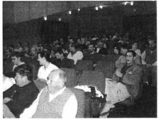
Hallgatóság az előadóteremben

A vasárnap reggel folytatódó találkozó első részében a sályi Lélek-lyuk titkaival és a Sopron környéki homokkő területen talált új barlangokkal foglalkozott az előadó. Ezt követően a bükki Peskő környéki, közelmúltban feltárt barlangokat, valamint a helyi viszonyok miatt nem zökkenőmentes albániai expedíció eredményeit ismertették a hallgatósággal. Beszámolót hallgattunk meg a már 5 km-es Solymári Ördöglyuk még nem befejezett térképezési munkáiról, valamint a Déli-Bakony újonnan megismert,