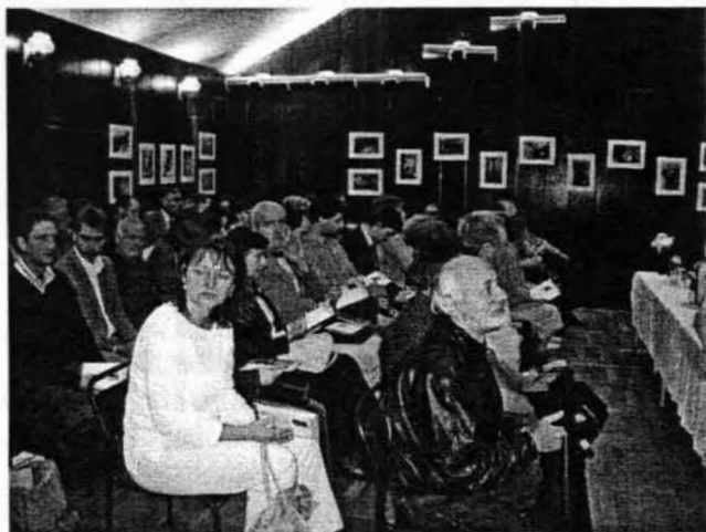
A rendezvény hallgatósága, a falakon a fotókiállítás képei

A rendezvény keretében került sor az évforduló alkalmából meghirdetett barlangi fotópályázat eredményhirdetésére és a beérkezett képekből összeállított fotókiállítás