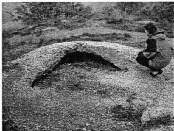
A gipsz térfogatnövekedése következtében kialakult gipszhólyag

Este fél tíztől a Bolognai Barlangkutató Csoport klubjában vártak bennünket, amely – szinte hihetetlen – de az egyik középkori városkapuban volt. Itt kapott helyet a „Fantini” Múzeum is, mely a klubhelyiség oldalfalai és folyosói melletti vitrinekben elhelyezett ásványgyűjteményből, régészeti és őslénytani leletekből, régi barlangkutató felszerelésekből áll. Nagyon kedvesen fogadtak, majd miután egyeztettük a hátralévő napok programját, még meghívtak bennünket egy italra a közeli bárba.