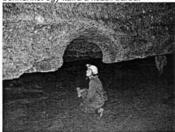
Jellegzetes járatszelvény a Spipola-barlangban

a társaságot. A legcsodálatosabb látvány sem tudta azonban feledtetni velünk azt a rettenetes mennyiségű agyagot, amibe a túrák során beleragadtunk.