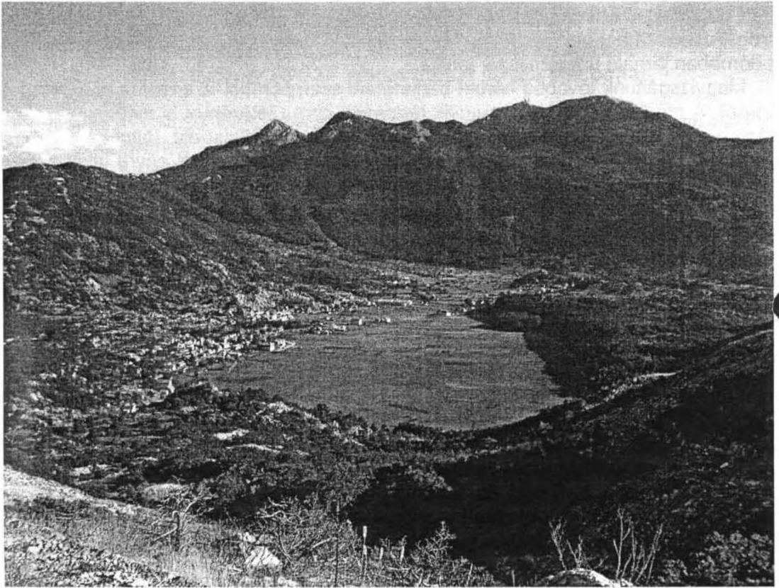
Kilátás a polje pereméről

felderítések során a második hét közepén az egyik oldaljáratból – az intenzív huzatot követve – egy újabb, még érintetlen barlangszakaszba jutottunk; amit a hátralévő idő alatt kb. 1 km hosszúságban és 120 m mélységig sikerült felderíteni. Az elért végponton az aktív meander tágas szelvényben, változatlanul ígéretesen erős huzattal folytatódik egy tavacska mögött. A térség híres szülöttjéről elkeresztelt Njegos-barlang általunk ismert hossza azonban még e jelentős új feltárással együtt sem éri el a 2,5 km-t; így vagy az angolok adatával nem stimmel valami, vagy a még be nem járt oldalágak is rejtenek további meglepetéseket.