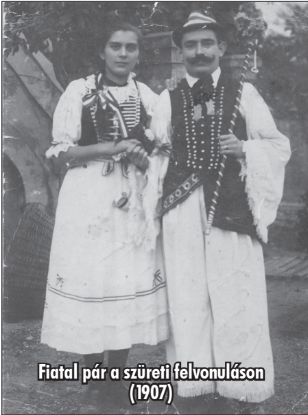
Fiatal pár a szüreti felvonuláson (1907)