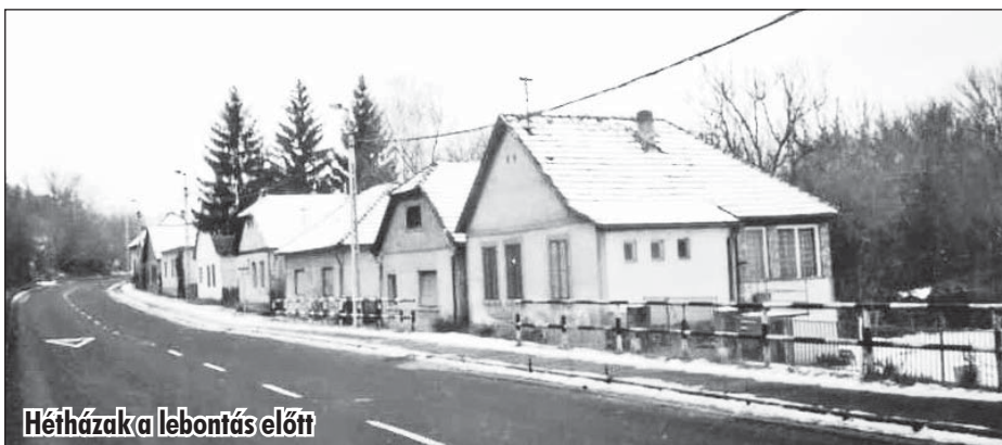
Hétházak a lebontás előtt