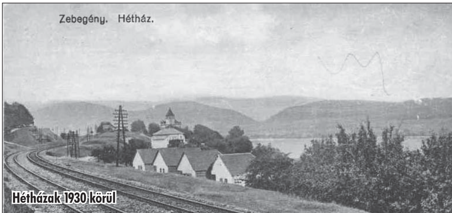
Hétházak 1930 körül