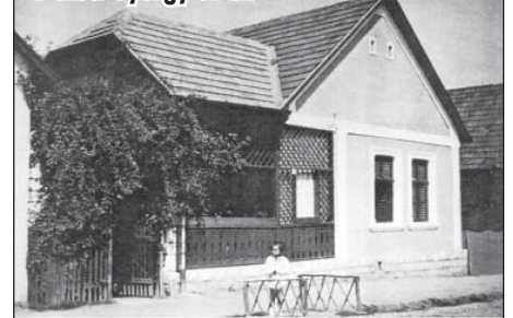
Dózsa György út 12.

Itt nyaraltak: Csathó Kálmán író Tavasz-tól tavaszig című könyvében is ír a zebegényi és nagymarosi vadászatokról.