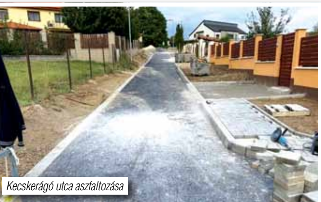
Kecskerágó utca aszfaltozása