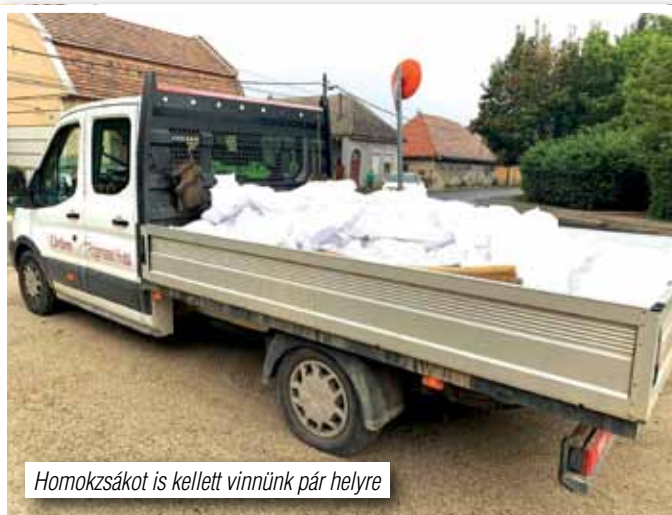
Homokzsákok is kellett vinnünk pár helyre