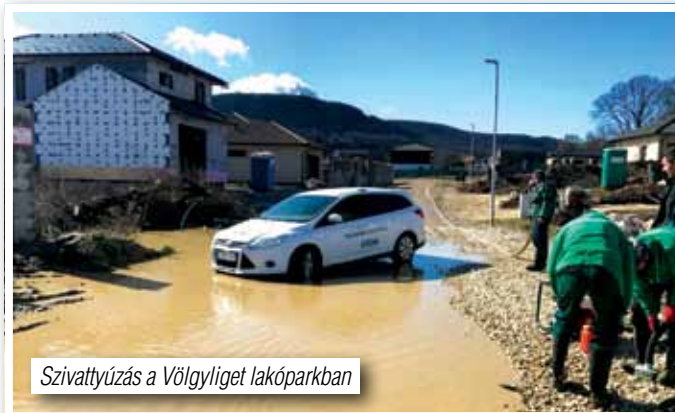
Szivattyúzás a Völgyliget lakóparkban