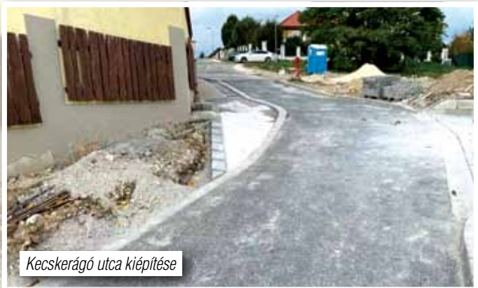
Kecskerágó utca kiépítése