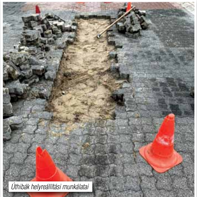
Útthibák helyreállítási munkálatai