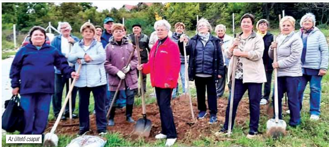
Az ültető csapat

A programra a 10 000 fő alatti települések jelentkezhet-tek be és 19 őshonos fafajtából min. 10 – max. 30 db fát igényelhettek. Az 500 millió Ft-os keretösszegű pályázat eredeti tervek szerint június és július között lett volna nyit-va, azonban a megnyitást követő fél óra elteltével lezár-ták, mivel a nagyszámú jelentkező kimerítette a rendelkez-ésre álló keretet.