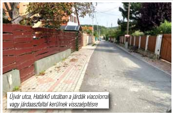
Újvár utca, Határkő utcában a járdák viacolorral vagy járdaaszfáltal kerülnek visszaépítésre