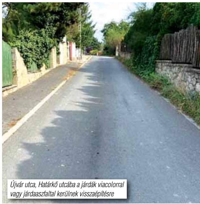
Újvár utca, Határkő utcába a járdák viacolorral vagy járdaaszfáltal kerülnek visszaépítésre