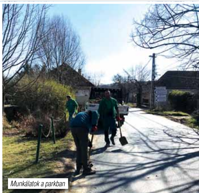
Munkálatok a parkban

Az idei évet tovább nehezítik a heves esőzések. A felhőszakadásokkal járó hirtelen lezúduló, nagy mennyiségű esőzések és az ezáltal kialakult vízfolyások jelentős károkat okoznak a településen. Az önkormányzat munkatársaival együtt minden esetben azonnal megkezdjük a védekezési munkálatokat, valamint szükség esetén a helyi vízkár elleni védekezés megfelelő fokozata kerül elrendelésre az eső által okozott károk megelőzésére, csökkentésére, illetve a mindezek ellenére mégis bekövetkező káresemények utáni helyreállításra.