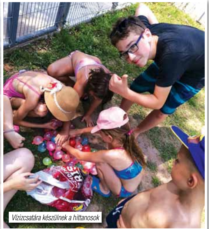
Vízizsátára készülnek a hittanosok

ós felkészítés. Közel 300 református hittanosunk van az óvodától az általános iskola nyolcadik évfolyamáig. Nagykonfirmandusaink közel 40-en vannak, kiskonfirmandusaink 30 fő körül. Sajnos a pandémia miatt az idei Kiskonfi Táborra most októberben került sor, s a járványhelyzet miatt, jelenleg 9 gyermek tud részesülni a Kiskonfirmációs Áldásban 2020. október 31-én 10:00-kor Ürömon református templomunkban, de már tervezzük a táborról lemaradtak levizsgáztatását is, akár egy újabb téli tábor keretei között.