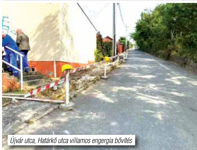
Újvár utca, Határkő utca villamos energia bővítés