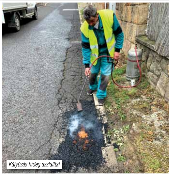
Kátyúzás hideg aszfalttal