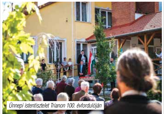
Ünnepi istentisztelet Trianon 100. évfordulóján

Nyár elejére lecsengett a pandémia első hulláma, s ez lehetővé tette, hogy a gyászos trianoni békediktátum 100. évfordulójáról méltóképpen emlékezhessünk meg. A gyülekezetünkben több dolgot is terveztünk június 4-re: emlékműavatást, testvérgyülekezeti találkozókat határon túli testvéreink és családjaik részvételével, Trianon100 ingek készítését határon belüli és túli konfirmandus gyermekeink számára, országzászló avatást Ürömön és Pilisborosjenőn, illetve szeretetvendégséget. Ezek közül idén az országzászló avatás történt meg Ürömön, elkészült az kézzel hímzett középcímeres zászló, amely a június 4-i megemlékezés után került ürömi templomunkba. S Szeretetvendégséggel egybekötött megemlékezés keretében vontuk fel templomkertünkben, ahol a kinti verziója most is lobog. Itt szeretném megköszön-