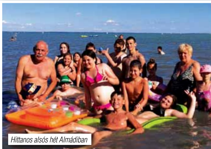
Hittanos alsós hét Almádiában

Hatalmas hála van a szívünkben Pilisborosjenő református népe miatt, mivel az imaházunk melletti kis udvart áldozatos munkával ki tudtuk takarítani gyülekezetünk ifjúságával, s egy nagyon jól sikerült vasárnapi gyülekezeti nap keretében fel tudtuk avatni egy nagy bogrács csülkös bablevessel, finom süteményekkel! Köszönöm a segítséget és a részvételt református családjainknak, gyülekezeti tagjainknak! Hálás a szívünk, hogy ebben az esztendőben eddig 8 házasságkötést áldhattunk meg, s 3 még függőben van. Sajnos keresztelőből eddig 10 volt gyülekezeteinkben, 13 volt a pandémia okán lemondottak száma. Református temetésből eddig 7 volt a két faluban, tavaly ilyenkor ez a szám 20 fő volt.