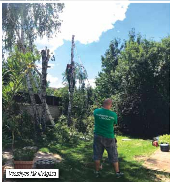
Veszélyes fák kivágása

• Parkok virágosítása, élőlő növények gondozása elkészült, valamint a nyári időszakban a zöldterület és gyomnövényekkel szennyezett közterületek kaszálása és a parlagfű mentesítése folyamatos volt