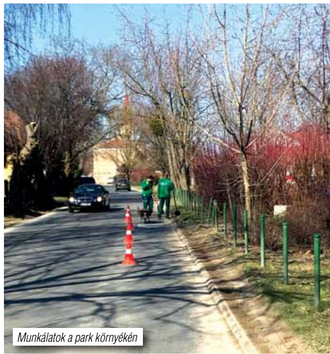
Munkálatok a park környékén