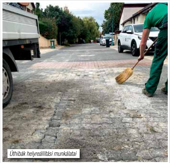
Útthibák helyreállítási munkálatai