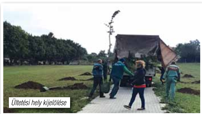
Ültetési hely kijelölése

Elültetésre került az a 30 db kislevelű hársfa, melyeket 2020. júniusában az Agrárminisztérium által meghirdetett Településfásítási programon az Önkormányzat elnyert.