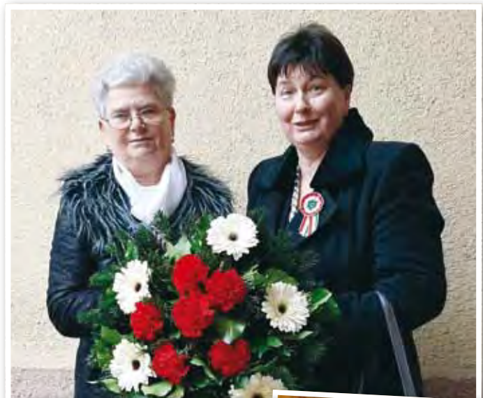
Koszorúzás a Március 15-i ünnepség alkalmából