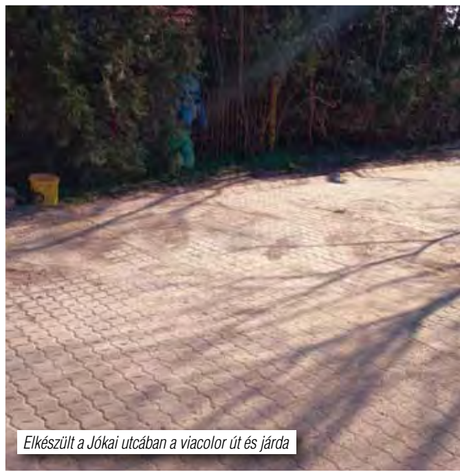
Elkészült a Jókai utcában a viacolor út és járda