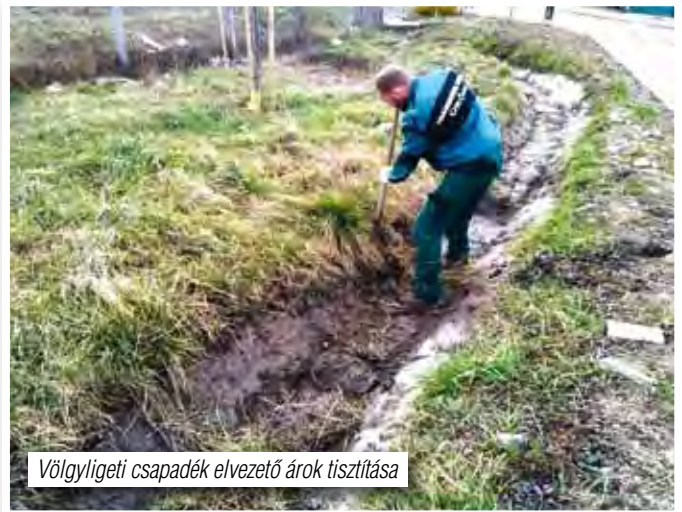
Völgyligeti csapadék elvezető árok tisztítása