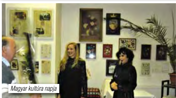
Magyar kultúra napja