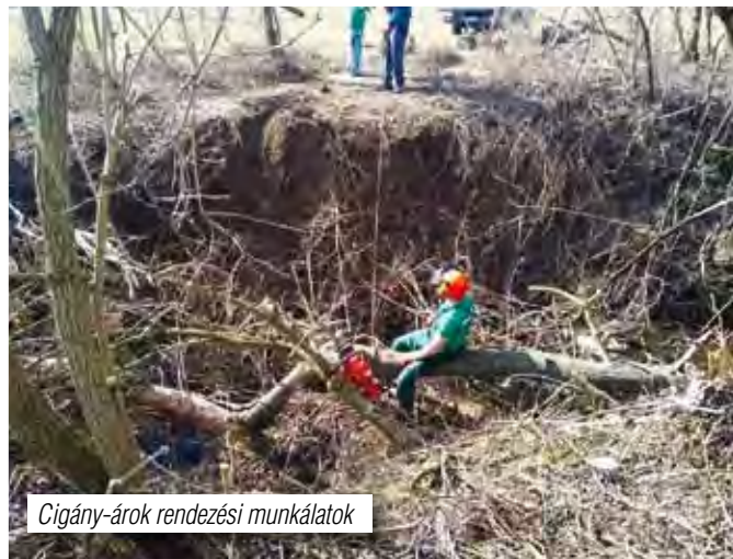
Cigány-árok rendezési munkálatok