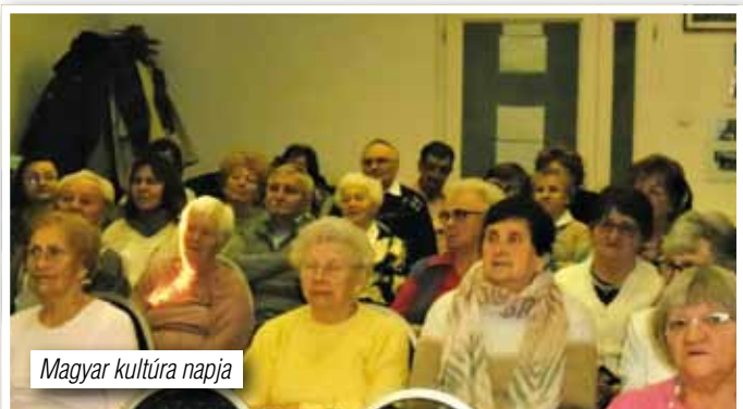
Magyar kultúra napja