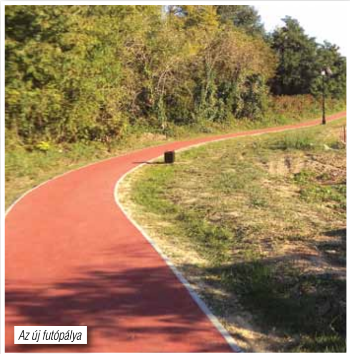
Az új futópálya

Még november hónapban is tartottak a kátyúzási munkák településünkön. Ez részben a kivitelező kapacitás hiánya miatt húzódott el, de az év végéig mindenképpen befejeződik, mivel a zöme november hónapban elkészült.