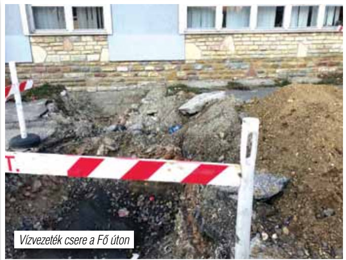
Vízvezeték csere a Fő úton

Előjáróban tájékoztatóul annyit, hogy annak idején, amikor a takarékszövetkezet épületét építették, figyelmetlenségéből ráépítették a víz gerincvezetékére. A többszöri, 2019-ben a szakásostól is több esetben előforduló meghibásodás és nem utolsósorban az üzemeltető DMRV-re az önkormányzat részéről történő folyamatos és rendszeres ráhatással elértük, hogy a gerincvezetékek cseréjére a Jókai utca, Fő utca érintett szakaszán, illetve a Takarékszövetkezet épületét érintően sor kerül.