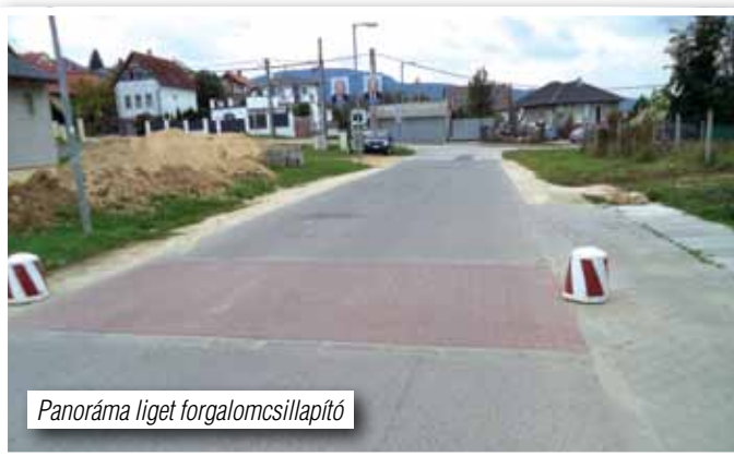
Panoráma liget forgalomcsillapító

Úgy gondolom, érdeklí tiszelt Lakótársaimat, hogy a választások óta eltelt időszakban milyen előrelépés történt és főleg mi a realitása annak, hogy ezek a beruházások belátható időn belül megvalósulnak. Az alábbiakban tehát most erről kívánok beszámolni.