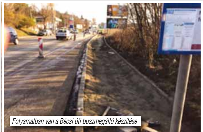
Folyamatban van a Bécsi úti buszmegálló készítése

Természetesen egyes feladatok, így az új művelődési központ építése pályázati lehetőség hiánya miatt elmaradt, de van olyan elmaradt beruházásunk is, melynek megvalósítását engedélyek elhúzóda hiúsította meg. Például Budapest, III. kerület szennyvízáttemelő felújítása, bővítése.