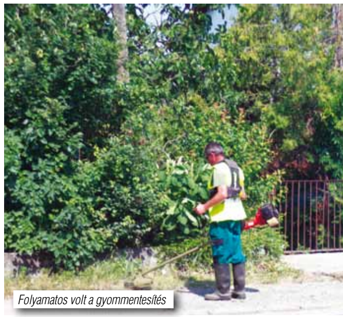
Folyamatos volt a gyommentesítés

Karácsonyi előkészületeink részeként tájékoztatom arról Lakótársainkat, hogy a község karácsonyfáját eb-