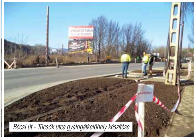
Bécsi út - Tücsök utca gyalogátkelőhely készítése

Tény, hogy több évvel ezelőtt lakossági kezdeményezésre, illetve kérelemre indította önkormányzatunk ezt a beruházást. A különböző szakhatósági, tulajdonosi és