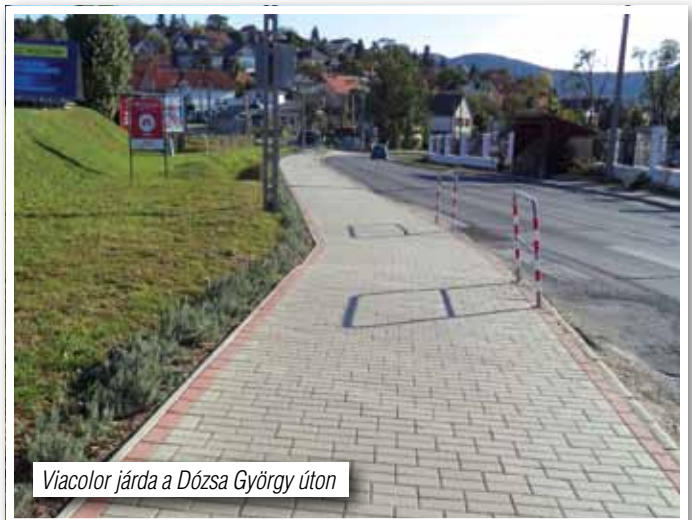
Viacolor járda a Dózsa György úton

54 db hársfát ültettünk el a Dózsa György út, illetve az Ürömi út mellett.