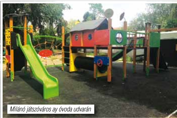
Milánó játszótér az óvoda udvarán

– Ugyancsak döntött a képviselő-testület a Völgyliget lakóparkban a belterületi utcákban a szilárd burkolat kiépítési, felszíni csapadékvíz elvezetési és forgalomtechnikai tervezési munkáinak indításáról. A munkákat önkormányzatunk fogja össze, ezért is került sor erre a döntésre.