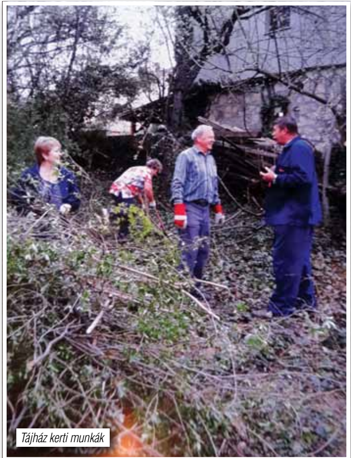
Tájház kerti munkák