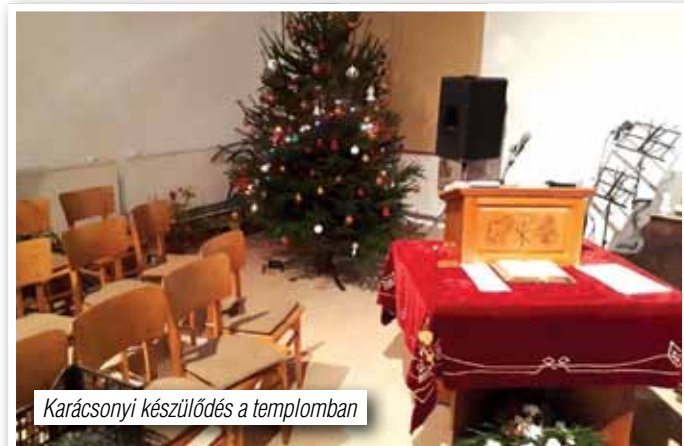
Karácsonyi készülődés a templomban