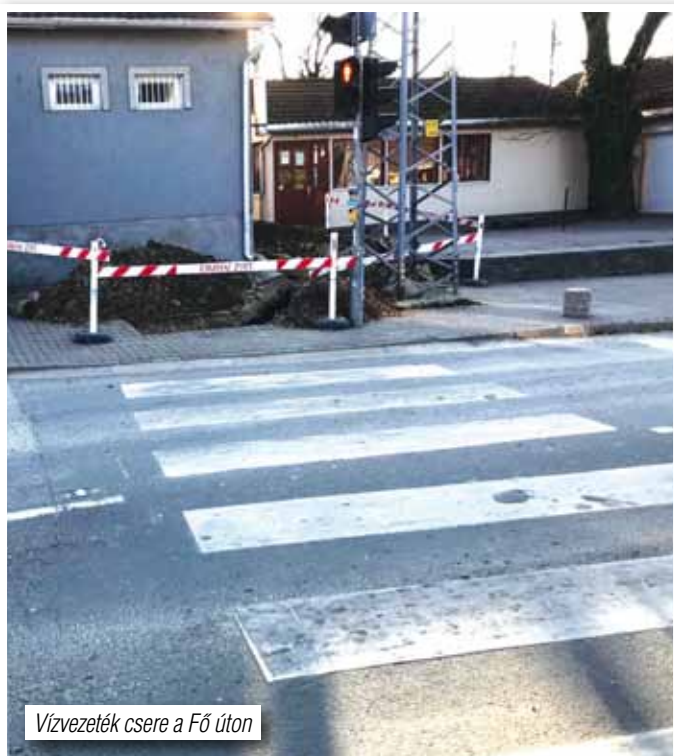
Vízvezeték csere a Fő úton