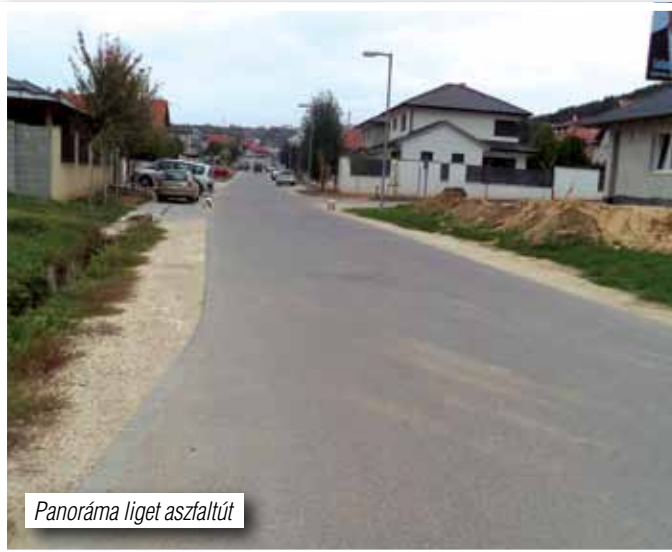
Panoráma liget aszfaltút