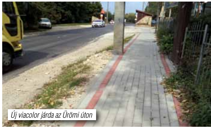
Új viacolor járda az Ürömi úton