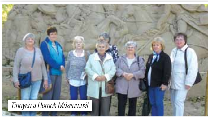
Tinnén a Homok Múzeumnál