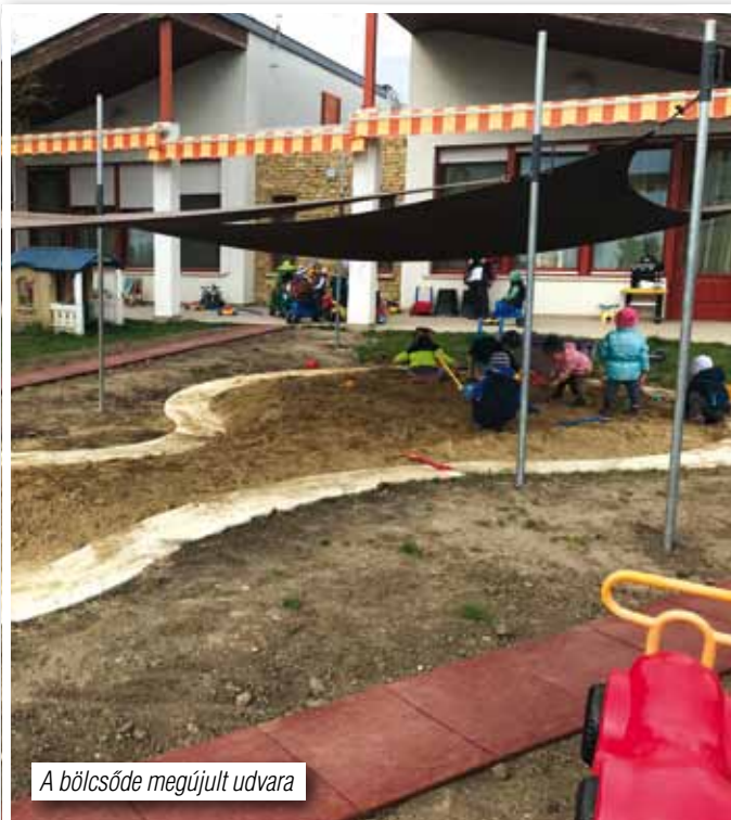
A bölcsőde megújult udvara

Tény, hogy Üröm önkormányzata a Kossuth és Tánicsics Mihály út felújítása előtt kérte már a DMRV-t arra, hogy azokban az utcákban, ahol indokolt a gerincvezetékek cseréje, végezzék el, mivel a felújított utcákat 10 évig nem lehet felbontani, kivéve a hibaelhárításos munkálatokat. Akkor a válasz az volt, hogy nincs rá keret. Minden esetre örülünk, hogy végül is az említett utcákban ez megtörténik.