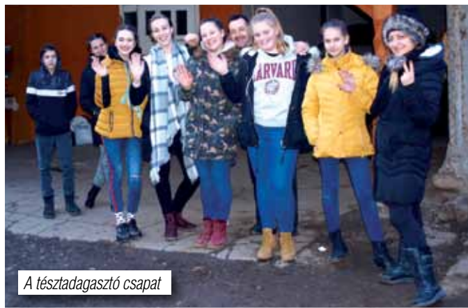
A társzadagasztó csapat

Mire felkelt a nap, már messze jártunk. Lassacskán mi is magunkhoz tértünk. A két csoportnak ez volt az első közös kalandja. Sok-sok óra, pár megálló, és jó néhány szendvics elfogyasztása után megérkeztünk az aprócska faluba, Szászcsávásra, ahol vendéglátóink már izgatottan és tárt karokkal vártak bennünket.