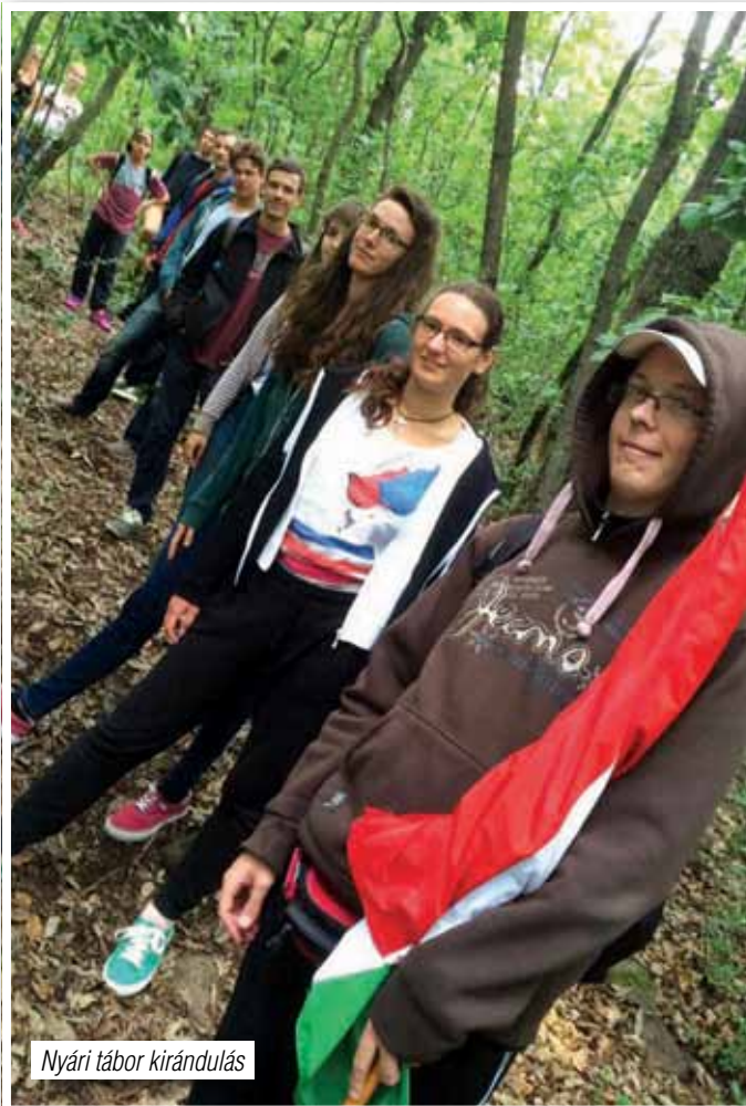
Nyári tábor kirándulás

Nagyon hálásak vagyunk az Élő Istennek, mert a karácsonyi alkalmaink a megszokott módon nagyon jól sikerültek, hiszen ebben az ünnepkörben találkozik a lelkipásztor szinte az összes hívével a gyülekezetben. Tavaly gyülekezetünkben összesen tíz karácsonyi istentisztelet volt, a „Szépkorúak” Karácsonyától kezdve az óvodás és a két falu iskolás hittanosainak műsorán keresztül a Misziós Karácsonyig közel ezernégyszáz testvérünk fordult meg gyülekezetünkben gyermekekkel, unokáikkal, szeretteikkel. Köszönjük, hogy eljöttetek és gyermekeitek munkáját! Nagyon hálásak vagyunk az Élő Istennek, hogy kezd ébredez-