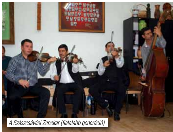
A Szászcsávási Zenekar (fiatalabb generáció)