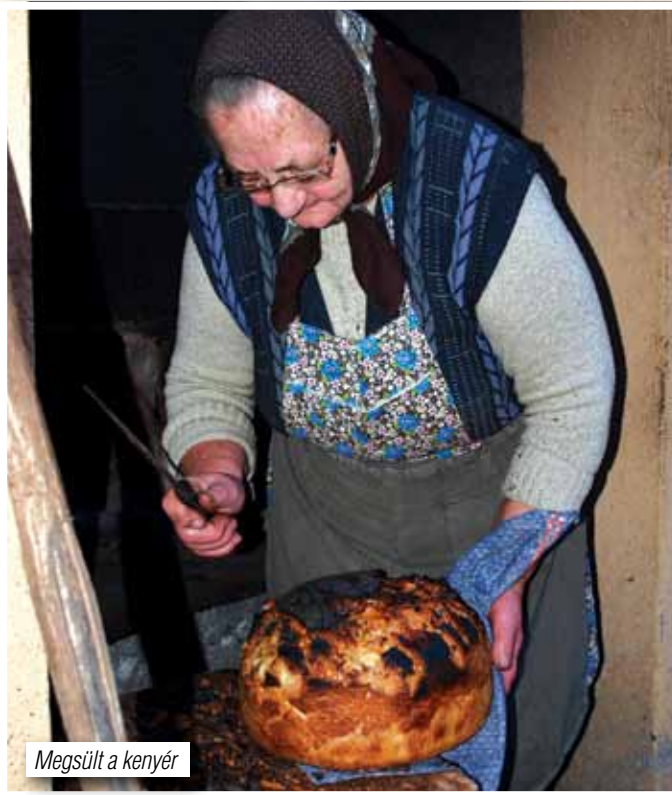
Megsült a kenyér