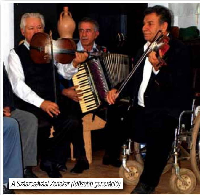
A Szászcsávási Zenekar (idősebb generáció)

A csomagok kipakolása és a fontos tudnivalók megismerése után elfoglaltuk szállásainkat ideiglenes családjainknál. A finom ebédet követően már az első próbára igyekeztünk, ahol csávási páros táncokat tanultunk. A két csoport hamar egymásra hangolódott.