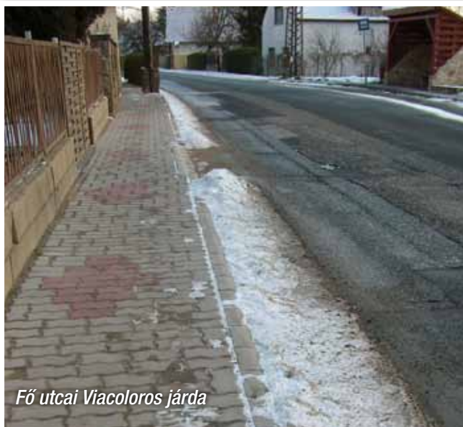
Fő utcai Viacoloros járda

Az ún. kínai üzlettől a Fő utca 113-as számig épült ki a viacoloros járda. Ugyanis a 60-as években a sötét mészkőből épített járdán a közlekedés már életveszélyes volt, tehát ezen a szakaszon szükségesszerű volt a járda megépítése.