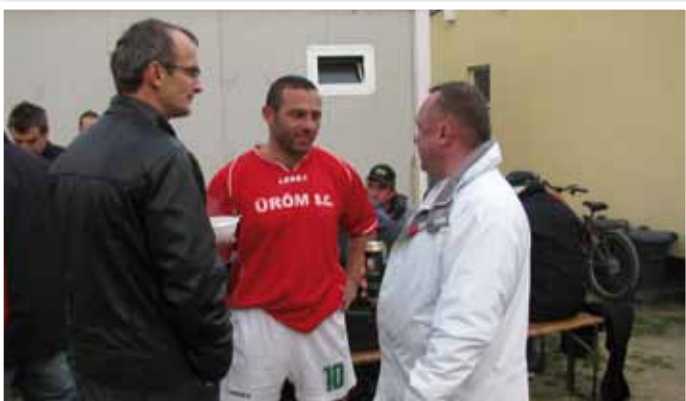
Csapatkapitányunk és támogatóink