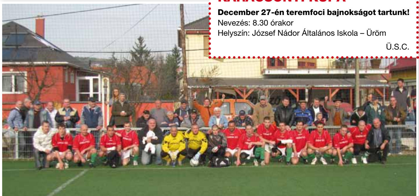
A csapat és a szurkolók