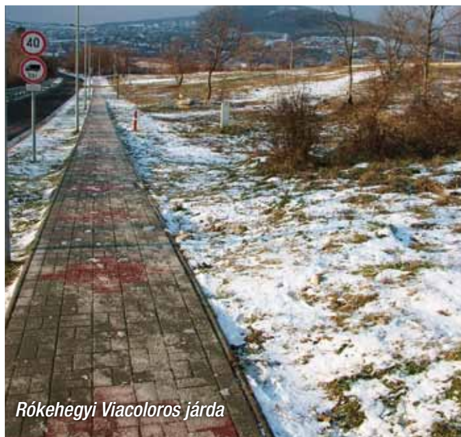
Rókahegyi Viacoloros járda

550 fm-en épült ki a járda, a veszélyes szakaszokon, korláttal és vízvezetéssel. Időszerű volt, hiszen egy nagyforgalmú út mellett eddig nem volt megoldva a gyakori közlekedés.