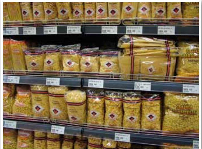
Ürömi száraztészta CBA-ban

A bejáratnál és a kávézó részleg előtt elhelyezett digitális poszterek folyamatosan tájékoztatják az előttük elhaladó vevőket az aktuális ajánlatokról, akciókról. Ezt a tulajdonképpeni elektronikus tájékoztató felületet, valamint az összes többi eladótéri marketingeszközt később a beszállítóknak reklámfelületként is értékesíteni lehet. A továbblépőket digitális borajánló kiosk segít, a készülék a vacsorához megfelelő innivalót ajánl, de akár borászat,