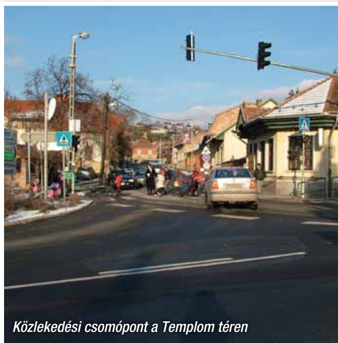
Közlekedési csomópont a Templom téren

Egy veszélyes csomópont biztonságossá tétele történt meg a Templom téri csomópont kiépítésével, úgy a közelben levő iskolát látogató gyermekek, mint az ott közlekedő felnőttek számára. Az üzembe helyezést követően egy-két kritikai észrevételtől eltekintve, örömmel fogadták a létesítményt, amely mára igazolta létjogosultságát.