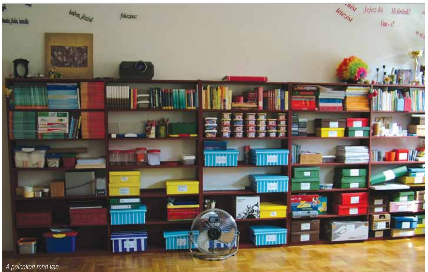
A polcokon rend van

Elkezdődött az iskola. Új tanév, új kihívások, új ígéretetek. Tanintézményünk létszáma évről-évre növekedik, az