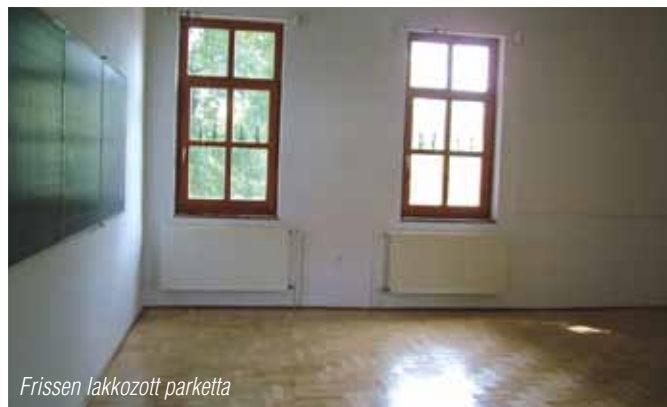
Frissen lakkozott parketta

Áprilisban várjuk a beiratkozó leendő elsőseinket, névadónkról József nádorról szintén áprilisban emlékezünk meg. Ebben az évben szerényebb körülmények között, József Nádor Kupa futóversenyt szervezve diákjaink számára.