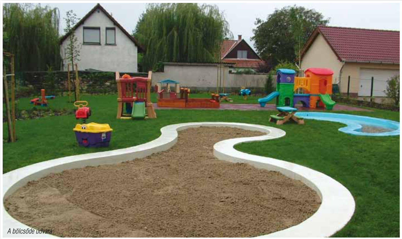
A bölcsőde udvara