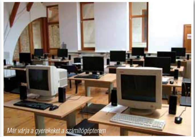
Már várja a gyerekeket a számítógépterem

Az önkormányzat támogatásával és ellenőrzésével minden teremben sikerült a tisztasági festést elvégezni. Nemcsak a falaink újultak meg, hanem a padjaink is. A beiratkozó első osztályos évfolyamon nagy örömeinkre három osztályt indíthattunk. Míg a két elsős osztály padjait a nagyoktól sikerült átörökítenünk – amelyeket természetesen gyönyörűen felújítottunk –, addig a harmadik elsős csapat vadonatúj padokat kapott. A felső tagozat berendezéseit is újjávarázsoltuk. A IV./a osztály termét felcsiszoltattuk és lelakkoztattuk. Augusztus elejére tisztán, felfris-