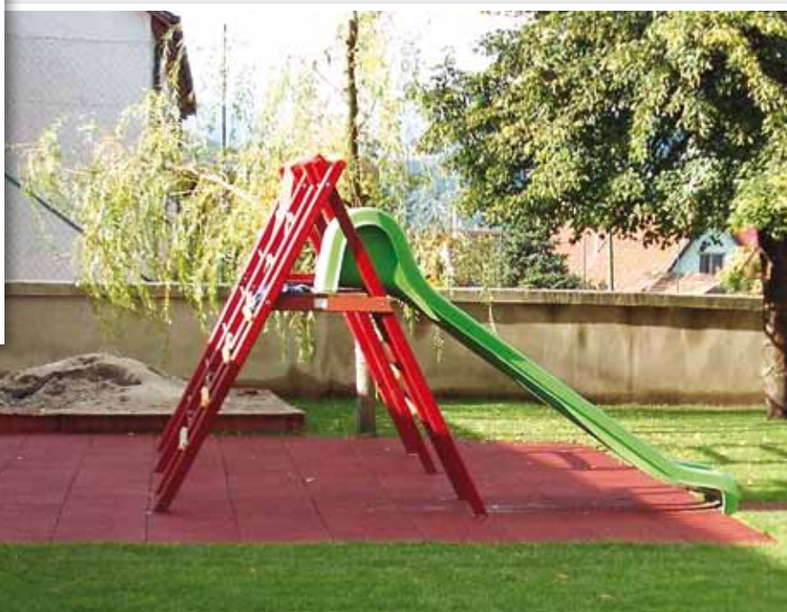
Az udvar a műsziklával, s a gumitéglával