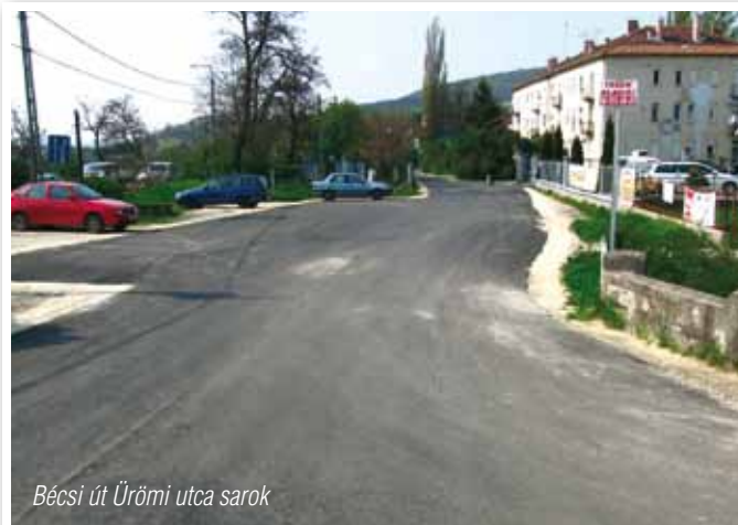
Bécsi út Ürömi utca sarok