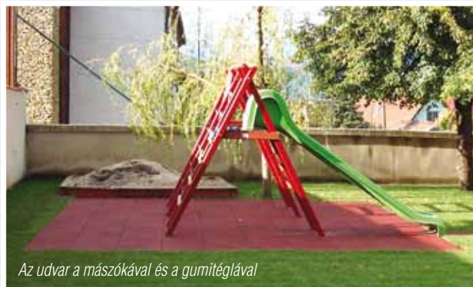
Az udvar a mászókéával és a gumitéglával

Ezzel a felújítással minden bizonnyal hosszú távra megfelelő körülményeket tudunk teremteni az intézményt igénybevevő óvodáskorú gyermekeink számára