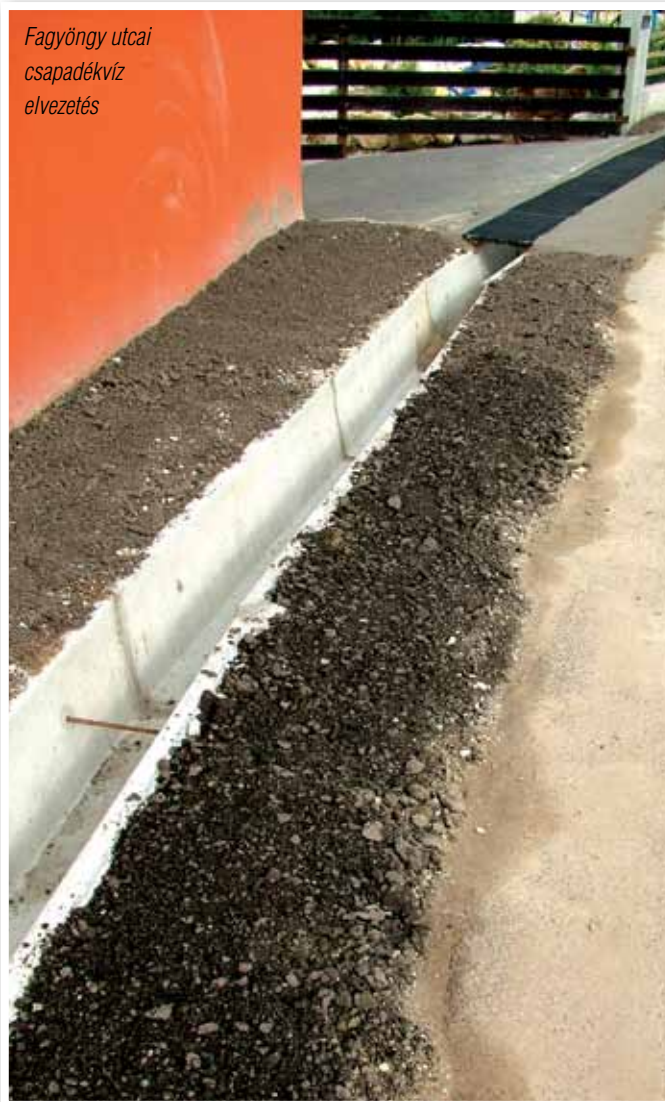
Fagyöngy utcai csapadékvíz elvezetés

Ugyancsak lakossági igényként jelentkezett a Gábor Áron sétány 11. előtt a szennyvíz visszaduzzadásának és ennek következményeként az ingatlanok elöntésének megakadályozására az ott levő forgalomcsillapító küszöb felszedése, újra rakása és burkolása. Ezzel egy időben elkészült a csővezeték lefektetése, valamint szikkasztó akna kiépítése. A forgalomcsillapító küszöb meg lett hosszabbítva és a gyalogjárda alá is csővezeték került beépítésre. Ezzel a szennyvíz lefolyása a jövőben megoldott, tehát az évek óta jelentkező kellemetlen probléma végére tettünk pontot remélhetőleg.