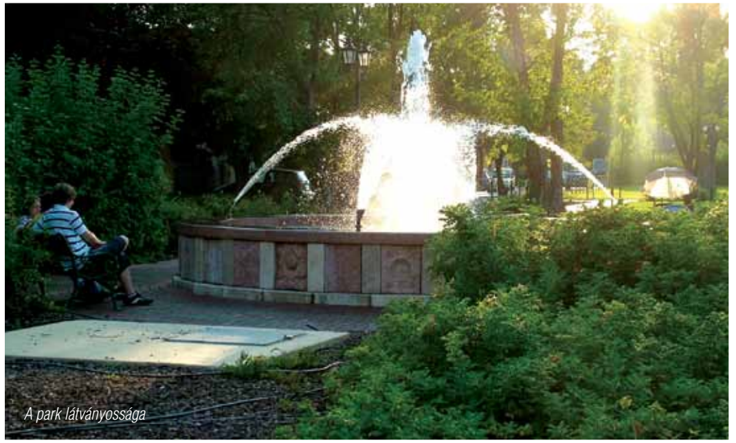
A park látványossága

A gazdasági program következetes végrehajtásának eredménye: