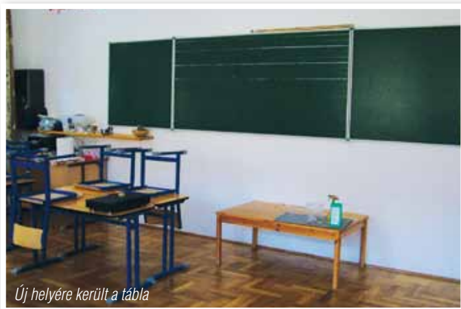
Új helyére került a tábla

A hagyománnyá vált novemberi Márton-napi lámpás felvonulást az óvodás csoportok és iskolásaink együttes felvonulásával kívánjuk községi szintű eseménnyé tovább gazdagítani. Ez évben a felvonulók – jó idő esetén – az önkormányzat előtti téren fognak gyülekezni, ahol az apró kis lámpások sokasága hangulatos fényt fog varázsolni a téren.