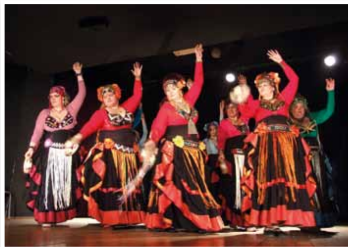
Emel Tribal hástánc együttes

Reméljük, hogy a Hagyományőrző Egyesület immár harmadik alkalommal hagyományt teremtett a kiszebáb égetéssel itt Ürömön.