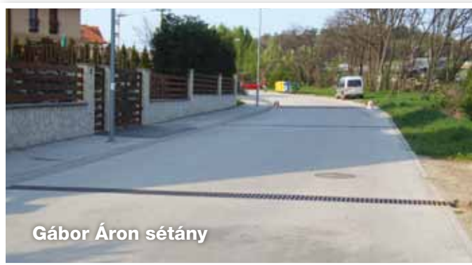
Gábor Áron sétány