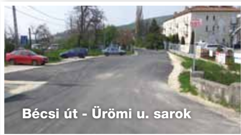
Bécsi út - Ürömi u. sarok

- Bécsi út - Ürömi u. sarkon bejáró és parkoló épült ki, a szerelvények szintbe helyezésére is sor került, továbbá tükörkészítés nemesített padka készítés, 5 cm-es vastagságban kiegyenlítő réteg és 5 cm-es vastagságban kopóréteg készült el.