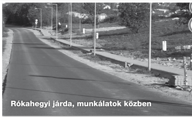
Rókahegyi járda, munkálatok közben

- Rókahegyen napokon belül befejeződik a temetőkapujától a CBA-ig 550 fm-en a gyalogos járda. Ezzel a biztonságos gyalogos közlekedési feltételeket kívánta javítani a képviselő-testület.