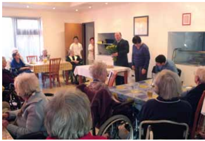
Laboda Gábor Polgármester köszönti a Platán hölgyeit

A tavasz a nők hónapja. Lányoké, asszonyoké, anyáké, nagymamáké. Köszöntik őket Nőnapra, Anyák Napjára. Aztán elmúlik a tavasz és természetes, hogy helyt állnak a munkában, otthon, a gyerekek, vagy már az unokák mellett.