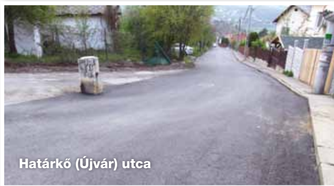
Határkő (Újvár) utca

- Határkő (Újvár) utcát elsősorban a Bécsi útról felkanyarodó útszakaszon az üröm hegyi lakosok, illetve a III. kerületi lakosok használják. A közigazgatási határt tekintve az útpálya közel fele Üröm területére esik a többi Bp. III. kerület. A kérdéses útszakasz olyan állapotban volt, hogy kátyúzni már nem lehetett. Ezért az utca alsó és felső szakasza 1480m 2 -en teljes 2+4 cm vastag aszfalterítést kapott, az érintett szakaszon a szerelvények szintre hozása is megtörtént. Többen érdeklődtek a további szakasz felújításáról, ezért már a helyszínen jelenlevő érdeklődőket is tájékoztattam arról, hogy a felújítással nem érintett útszakasz már teljes egészében a Főváros III. kerületéhez tartozik, tehát ott Üröm önkormányzata nem épít utat.