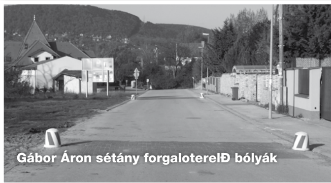
Gábor Áron sétány forgaloterelő bolyák

Táborföld településrészen telepített forgalomcsillapító küszöböket az autós közlekedők úgy igyekeztek kikerülni, hogy a járdára is felhajtottak gépkocsikkal. Kisgyermekes szülők panaszolták ezt, ezért az önkormányzat „betonbabákat” helyeztetett el valamennyi forgalomcsillapító küszöbnél.