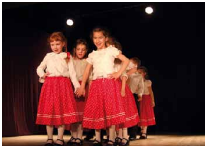
Ürömi Öröm néptánc csoport