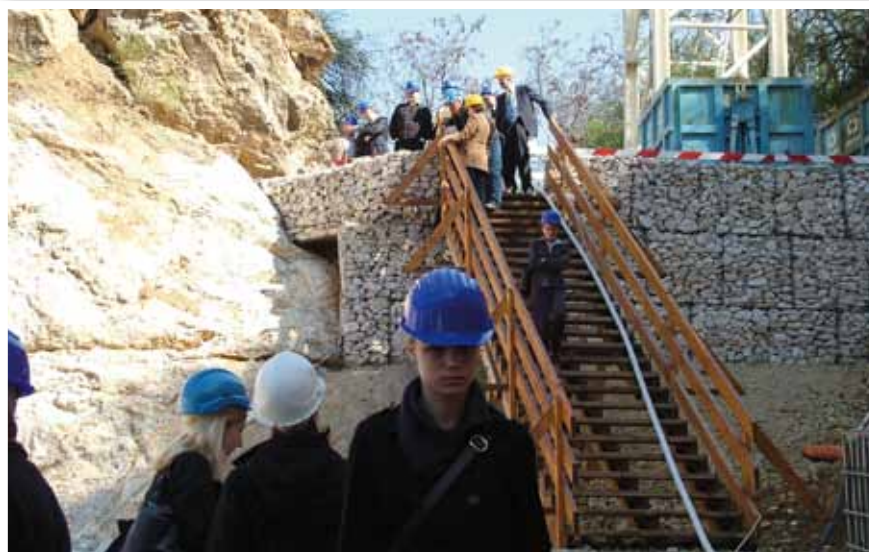
Média képviselői meglátogatják a bánya területét

A projekt során a rendkívül nagy mennyiségű gáztisztító masszát kotrógéppel - a bányaüreg mélyebb pontjairól toronydarúval - ki kellett termelni, mérlegelni, aztán egy e célra épített kiszállító úton, biztonságos járművekkel elszállítani a településről. A folyamat vége az ártalmatlanítás, ami a Borsodi Érc-, Ásvány- és Hulladék Hasznosító Műben történik.