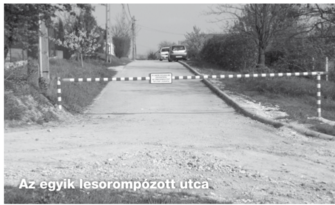
Az egyik leSOROMPÓZOTT UTCA

lítják, és várhatóan a későbbiek során majd az építkezés, az építőanyag szállítási útvonala is ez lesz. Természetesen a lakossági jelzésre az önkormányzat az azonnali intézkedést megtette, úgy hogy sorompóval zárta el Pilisborosjenő felől az érintett utcák megközelíthetőségét. Igaz arra is sor került, hogy a lerakott sorompókat felfeszítsék, tehát kénytelen voltunk leheggeszteni.