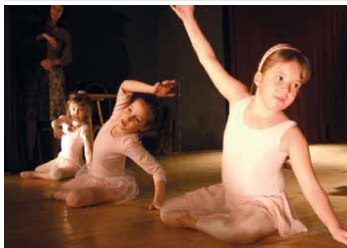
József Nádor Általános és Művészeti Iskola balettcsoportja

Műsorunkban felléptek a József Nádor Általános és Művészeti iskola balett csoportja. A kis balerinák ügyesen mozogtak a színpadon. Az Emel Tribal hastánc csoport hangulatos zenére táncukkal és a színes ruháival elbűvölték a közönséget.