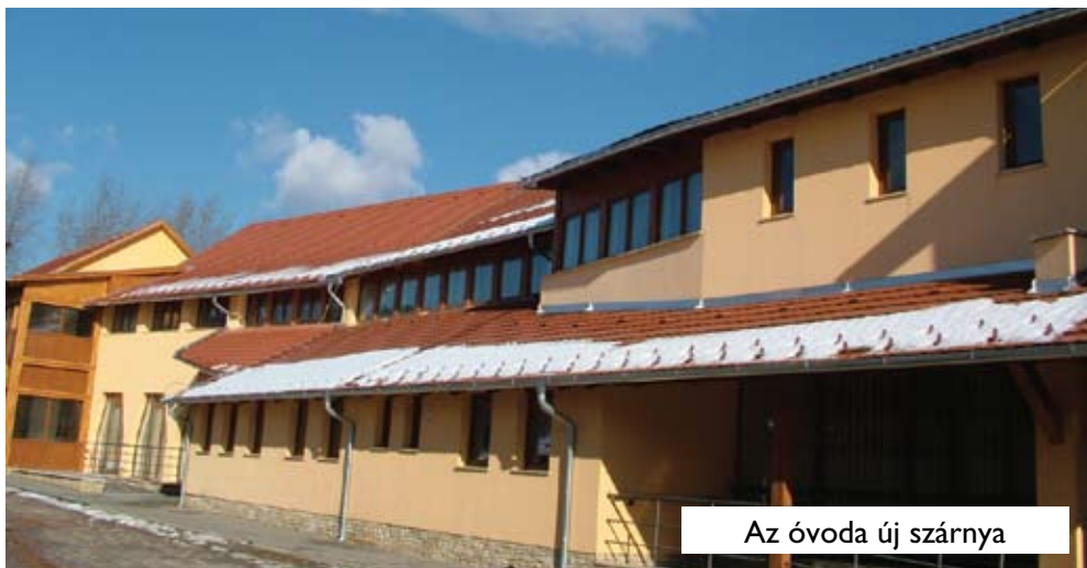
Az óvoda új szárnya

Laboda Gábor: Természetesen! A 2009-re elfogadott költségvetésünk 1 milliárdot meghaladó nagyságrendű bevétellel, és ugyanilyen nagyságrendű kiadással számol.