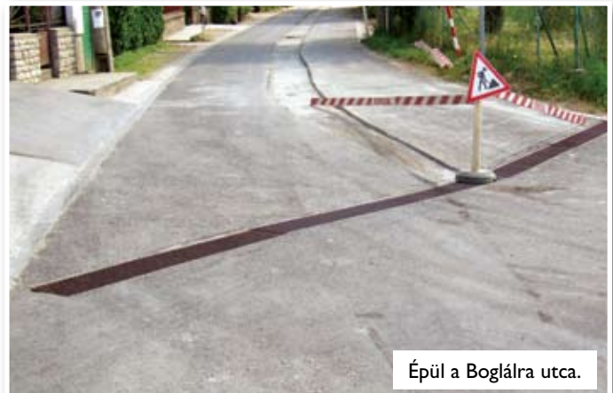
Épül a Boglárka utca.

Megkezdődött a Boglárka utca felújítása, amelyet a korábbi években kiépített felszíni vízfolyó balesetveszélyessé válása is indokolt. A balesetveszélyessé vált felszíni vízfolyó teknő új, 15 cm betonlapot kapott, és körülbelül 10 cm vastagságban és 50 cm szélességben került aszfaltozásra úgy, hogy a víz továbbra is az úttest közepén folyjék el, illetve biztosított legyen a csapadékvíz elvezetése. Ezzel a munkálattal a korábbi balesetveszély is megszűnt.