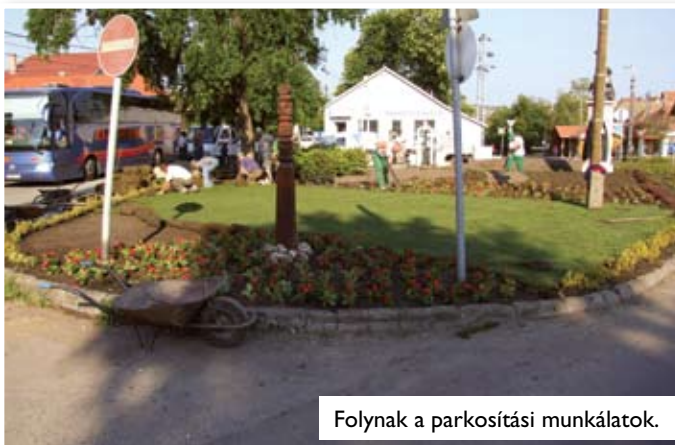
Folynak a parkosítási munkálatok.

Rendszeres gondozással és ápolással egész nyáron, késő őszig fognak a kiültetett virágok pompázni. Ezt biztosítja a kiépített locsolórendszer is.