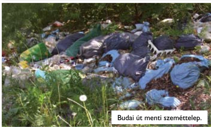
Budai út menti szeméttelep.

A Föld napja alkalmából Ürömmön áprilisban Tisztasági Napot tartottunk. A József Nádor Általános Iskola felsős tanulóinak segítségével a Kis-domb és annak környezete került megtisztításra az ott lerakott illegális szemétkupacoktól. Az iskolások másik csoportja a Fő utcai parkban tisztogatott, illetve segített a talajtakaró mulcs kihelyezésében. Remélem, hogy az ÖKO iskola tanulóinak ez a “terepmunka” a környezettudatos szemléletét segíteni fogja.