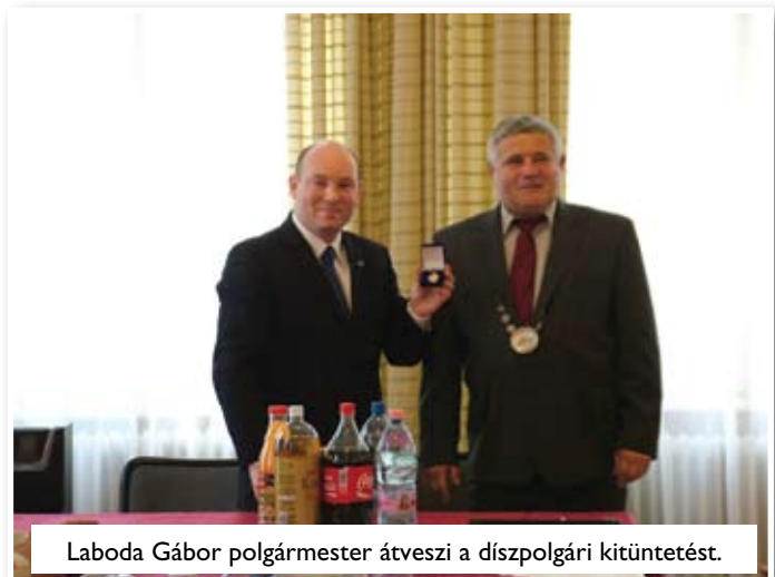
Laboda Gábor polgármester átveszi a díszpolgári kitüntetést.