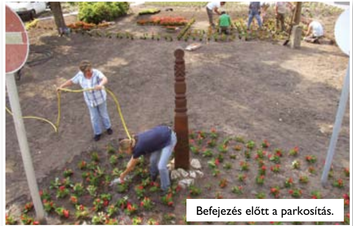
Befejezés előtt a parkosítás.

Megkezdődött a Boglárka utca felújítása, amelyet a korábbi években kiépített felszíni vízfolyó balesetveszélyessé válása is indokolt. A balesetveszélyessé vált felszíni vízfolyó teknő új, 15 cm betonlapot kapott, és körülbelül 10 cm vastagságban és 50 cm szélességben került aszfaltozásra úgy, hogy a víz továbbra is az úttest közepén folyjék el, illetve biztosított legyen a csapadékvíz elvezetése. Ezzel a munkálattal a korábbi balesetveszély is megszűnt.