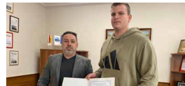
Év vállalkozása Díj Dr. Bata Zrt.