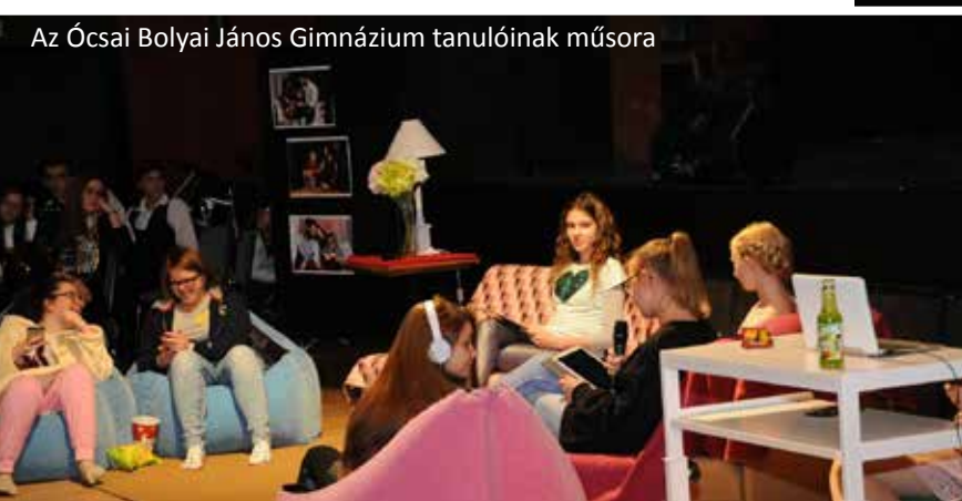
Az Ócsai Bolyai János Gimnázium tanulóinak műsora