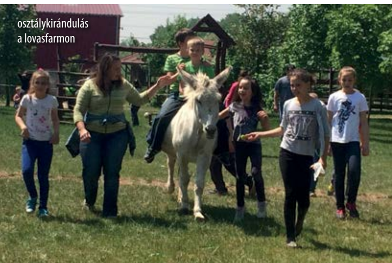
osztálykirándulás a lovasfarmon

Igazság szerint ma már tudom, hogy mennyi mindenem múlik, hogy milyen eredményeket ér el egy gyerek lovágásban. Nem mindegy milyen háttérrel lovágol, milyen módszerrel tanítják, és még sorolhatnám. Én otthonról nem kaptam támogatást, így saját erőből – bár szalagok és kupák jutottak bőven – nem értem el azokat az eredményeket, amikre vágytam. Persze nem akarok keseregni.