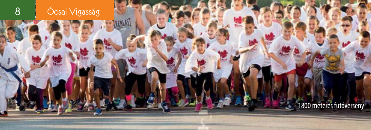
1800 méteres futóverseny