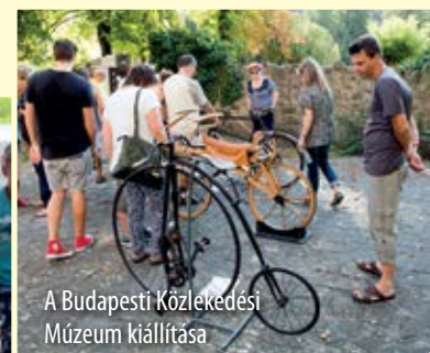
A Budapesti Közlekedési Múzeum kiállítása

Igen. Az elmúlt hónapokban sokan megkerestek bennünket, hogy szervezzünk utcabált az idei vigasságra. Volt már olyan év, amikor próbálkoztunk ilyen jellegű programmal, de azt sajnos akkor elmosta az eső. Idén igazán jó lezárása volt ez a rendezvénynek. A zenét lemezlovas szolgáltatta. A legnagyobb slágerek hangoztak el, együtt táncoltunk, együtt énekeltünk.