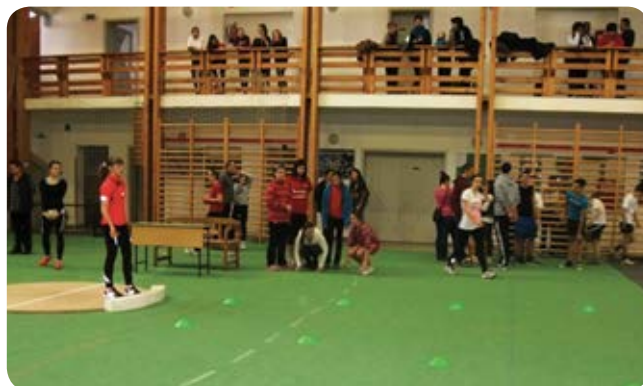
FORRÁS: SPÁK JÓZSEF