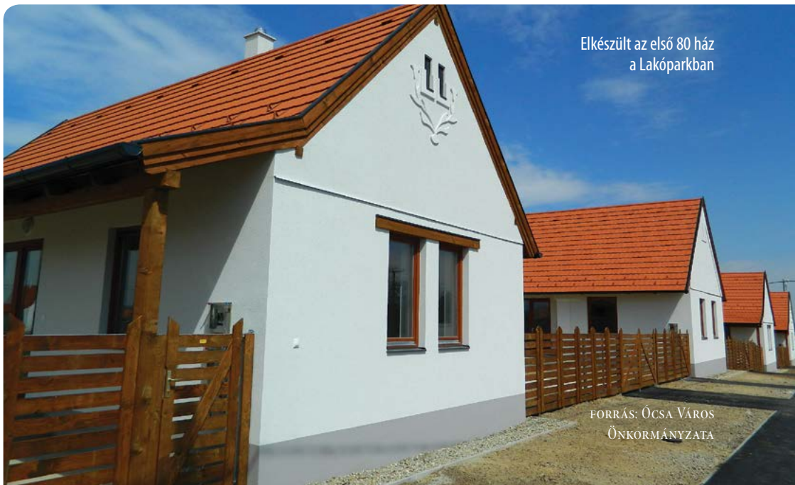
Elkészült az első 80 ház a Lakóparkban