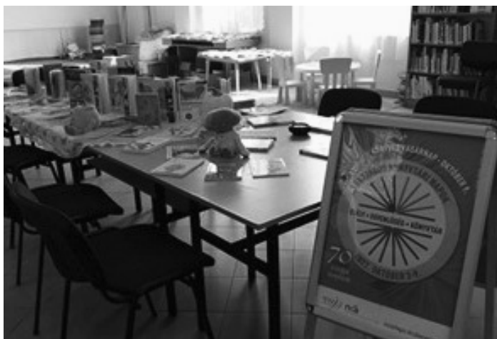
Kiállítás egészség témakörben