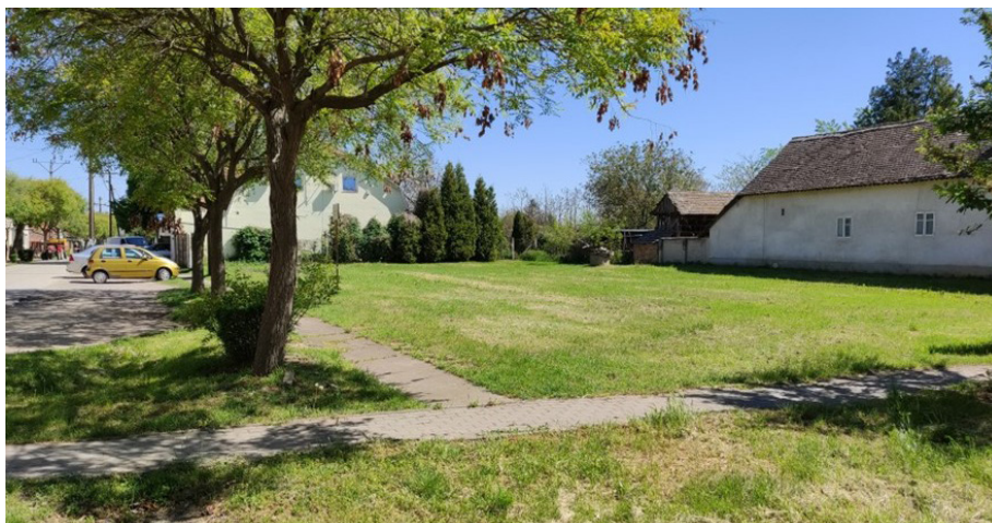
Itt áll majd az apátfalvi piac

A Kossuth Lajos utca 63. szám alatti ingatlanon, mely a Kossuth és a Hunyadi utcák sarkán fekszik, épül majd meg a piac. A piac lehetővé teszi a projekt fő céljának a megvalósítását, azaz biztosít