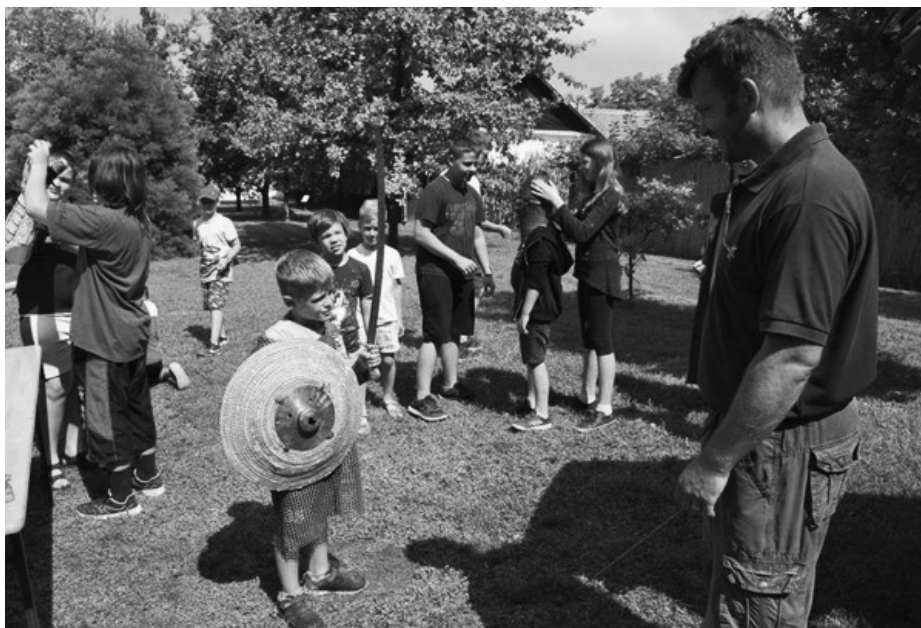
Izgalmas csaták elevenednek meg az apátfalvi hagyományörzők rendezvényein.