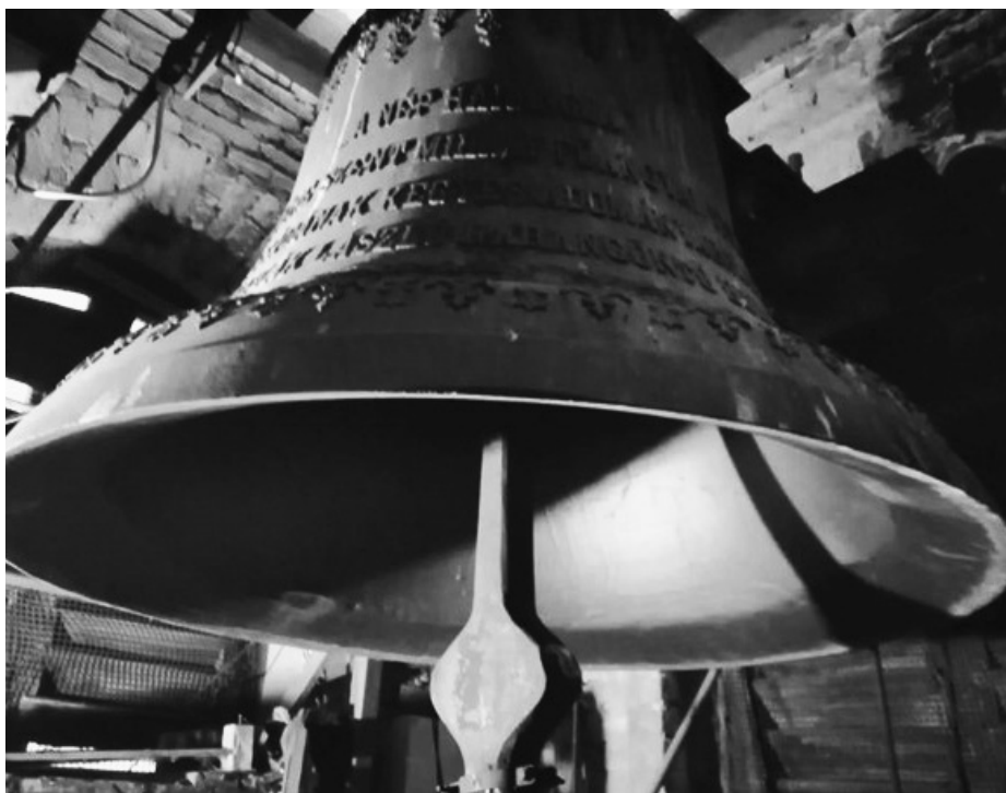
Az apátfalvi harangok nemcsak szépen szólnak, de jól is mutatnak.

dennemű veszedelemtől való isteni gondviselés kérésére, a legkisebb (lélekharang) a szenvedő és elhaltak lelkének üdvösségére öntetett. A templom tornya 31 méter. A templomot 1932-ben kibővítették. Új tornyot, oldalhajókat és új szentélyt építettek. Titulusa Szent Mihály főangyal, a mennyei seregek vezére, Isten hűséges szolgája, aki legyőzte és az alvilágba taszította az Isten