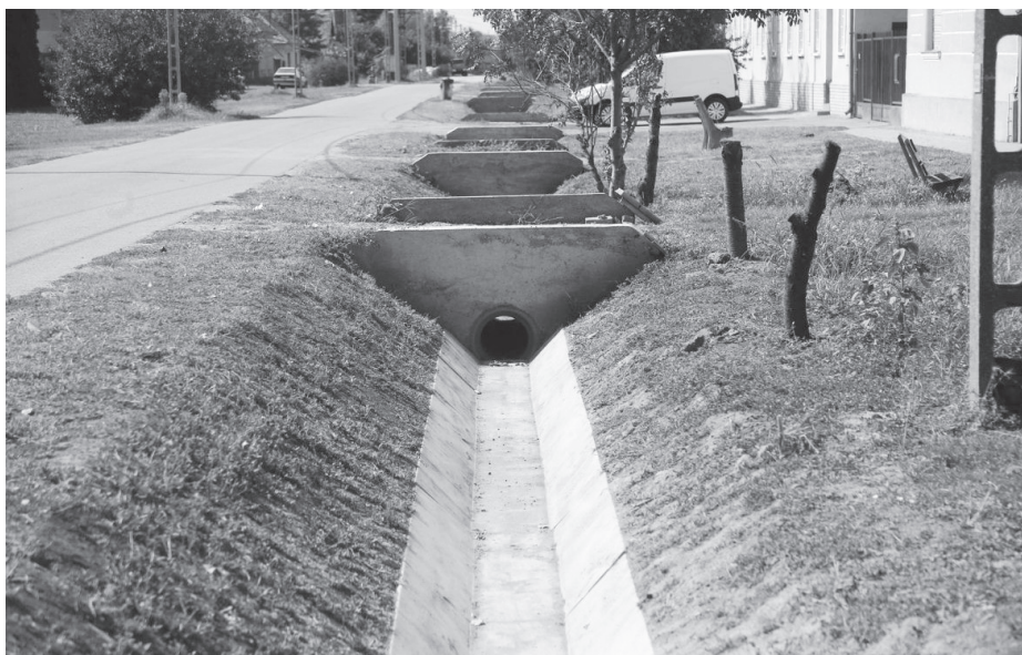
Befejeződött a csapadékvíz-elvezető hálózat építése.

■ A IV. Országos Közfoglalkoztatási Kiállítás és Vásárt 2018. szeptember 14-én és 15-én rendezte meg a Belügyminisztérium Budapesten a Millenáris területén. Megyénkből az Önkormányzatok közül csak Apátfalva kapott felkérést a kiállításon való részvételre.