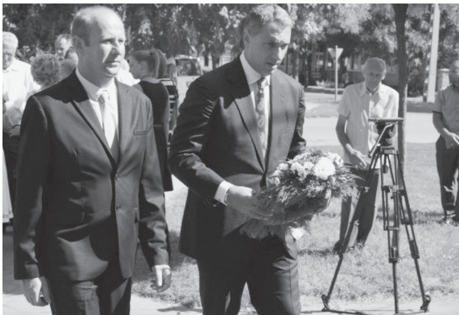
Koszorúzás augusztus 20-án.

■ Augusztus 20. az államalapítás ünnepe. Az ünnepségen részt vett Lázár János is, a térség országgyűlési képviselője.