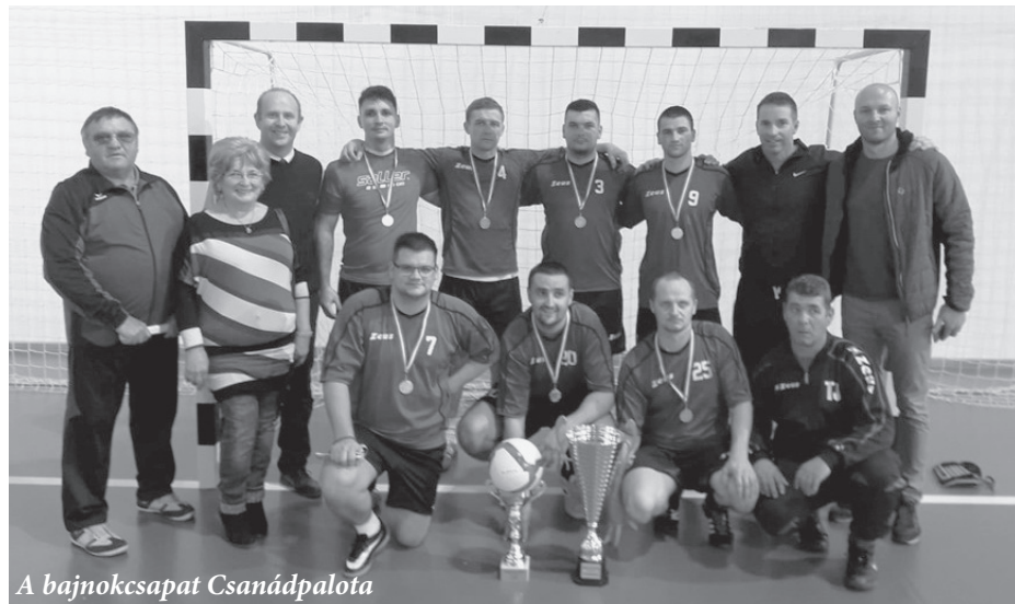
A bajnokcsapat Csanádpalota