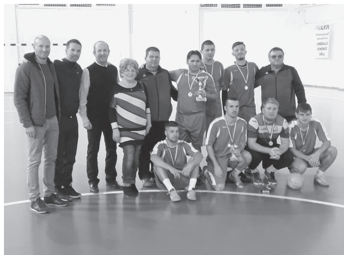
A harmadik helyezett Cenad ( Románia )