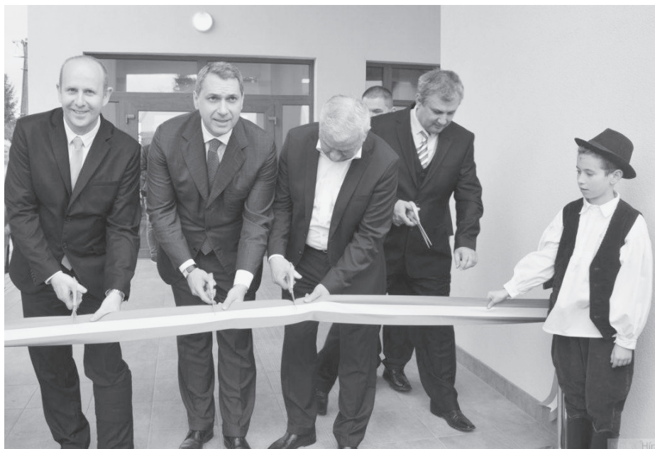
Az apátfalvi sportcsarnok átadása.

■ Május 18-án ismét megrendeztük óvodánkban a családi napot. Minden óvodába járó gyermek szülei és nagyszülei is ellátogatottak ezen a napon az óvodába és részt vettek a tevékenységekben.