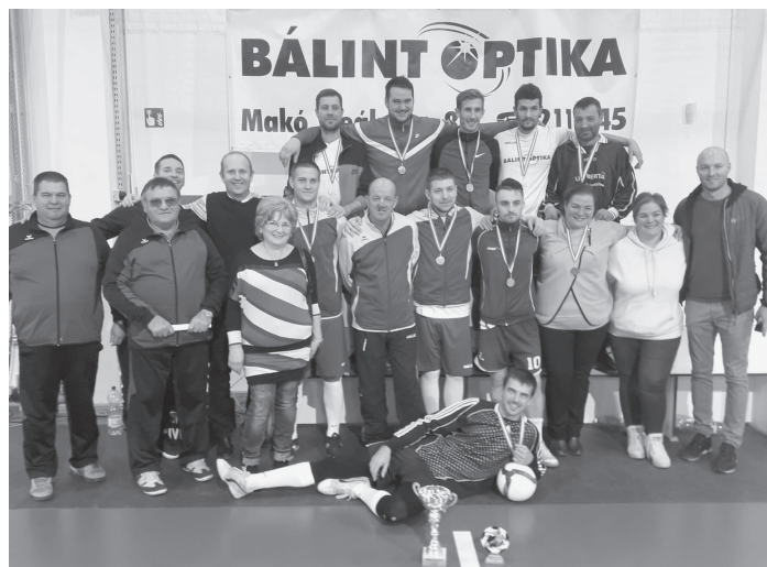
A második helyezett Bálint Optika Makó