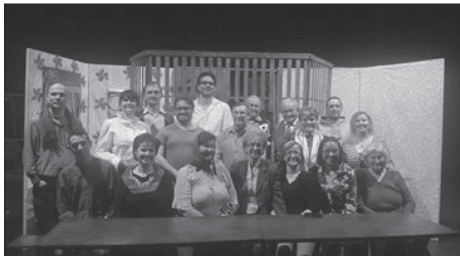
Együtt a két csapat: a vásárhelyi Besse nyei Színkör és az apátfalvi Pódium Színpad tagjai

A magyarcsanádi fellépés után február 13-án este Hódmezővásárhelyre látogattunk, ahol részt vehettünk a vásárhelyi Besse- nyei Színkör készülő darabjának próbáján.