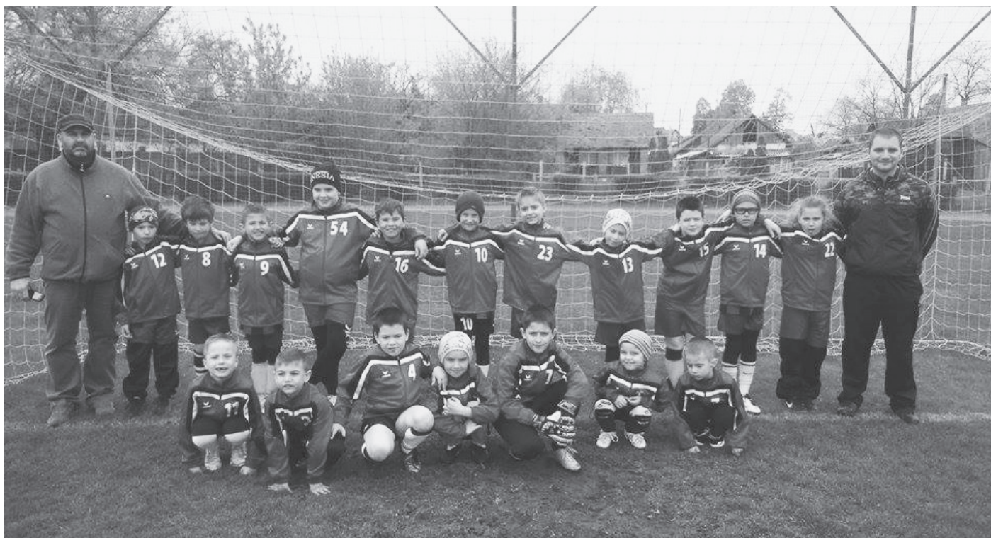
AZ U11-ES KOROSZTÁLY