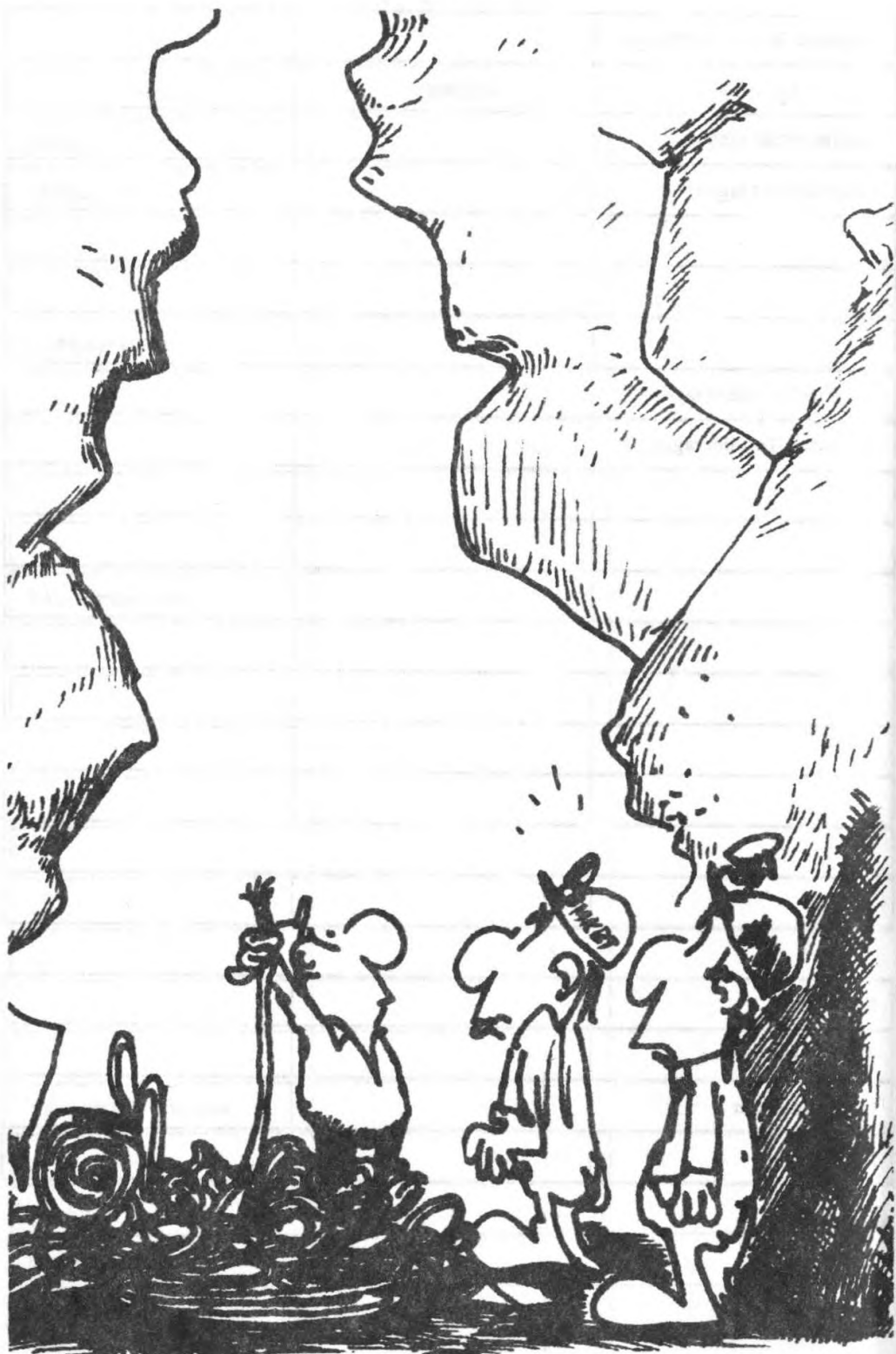
Valaki megint megronthatta az erdészettel a jóviszonyunkat! (© O. M. Wisdom 1970)