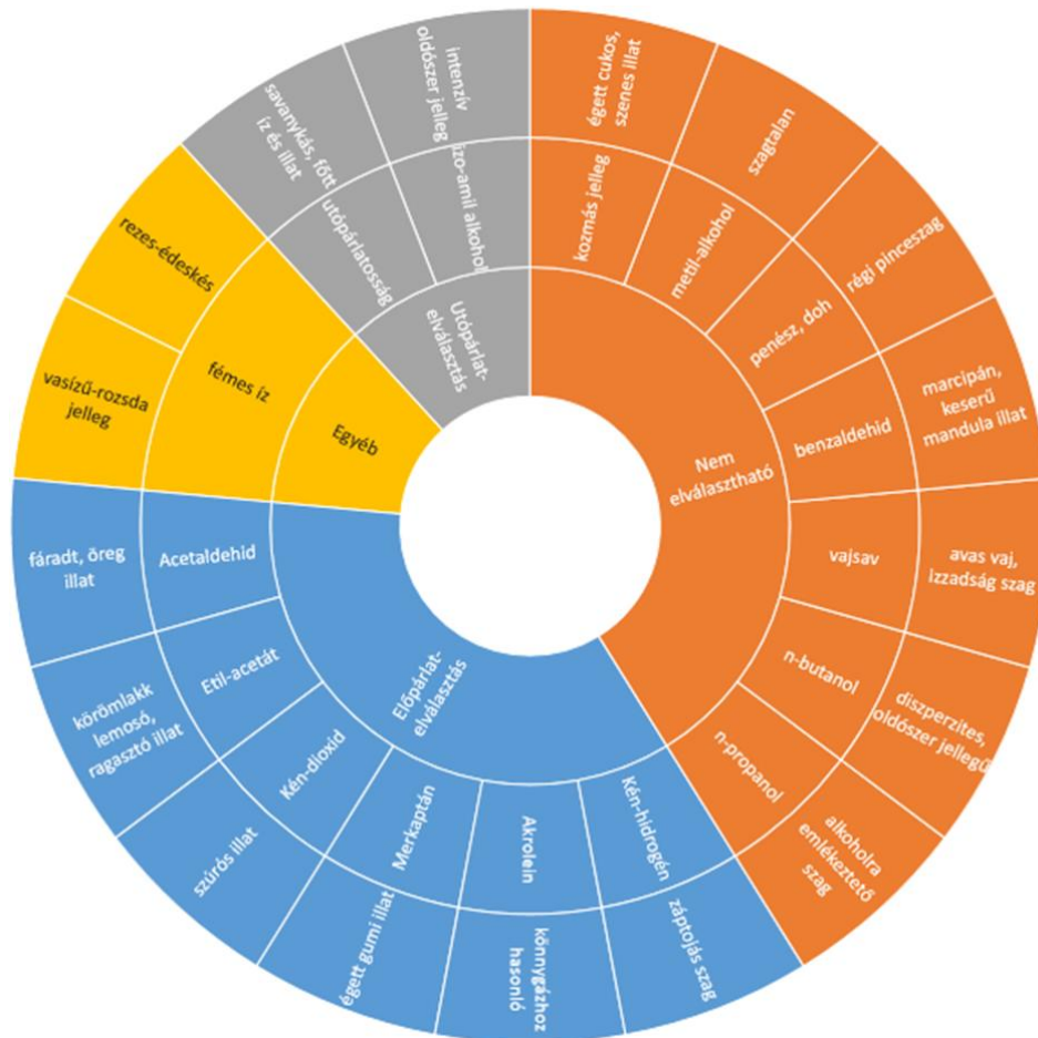
6. ábra: A pálinkahibák aromakereke.

Célszerű lenne a külföldi mintákhoz hasonlóan a pálinka-aromakerék kidolgozása. Elkészítettem egy, a pálinkahibákat tartalmazó változatát, melyet a 6. ábra szemléltet.