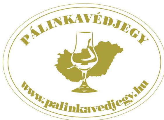
4. ábra: a pálinkavédjegy.