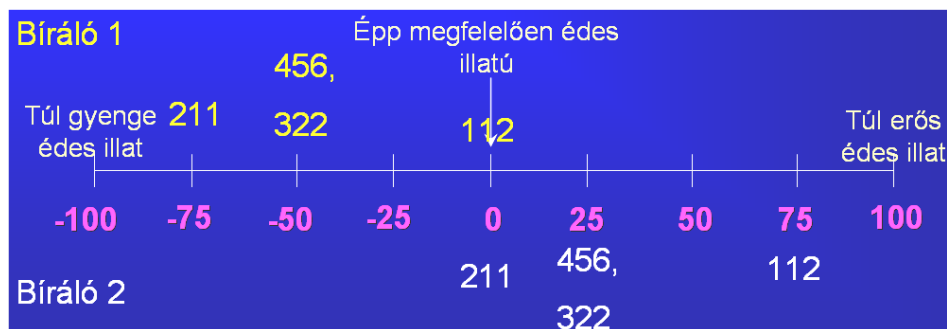
5. ábra: Példa kétirányú skálára.

Az érzékszervi minőséget egyetlen pontszámra sűríteni hatalmas adatvesztést jelent. Ráadásul az egyes részpontszámok összeadódnak, s így egy gyengébben teljesítő tulajdonság veszteségét egy jobban teljesítő tulajdonság kiegyenlítheti. Ezért a korszerű minőségellenőrzési rendszerek, ha alkalmaznak is pontszámokat, akkor azt tulajdonságonként teszik.