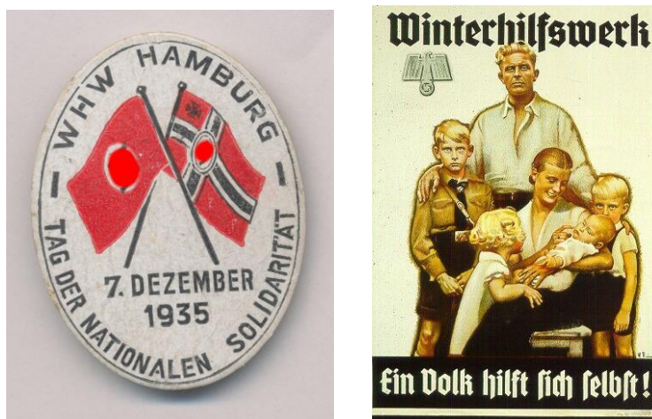
Egy hamburgi téli segély program jelvénye. „1935. december 7. – A nemzeti szolidaritás napja.” 29

forma.” 26 1936. december 1-én törvénybe is iktatták a téli segély programját. „A német nép téli segélyszolgálatát a birodalmi propaganda- és népfelvilágosítási miniszter vezeti és felügyeli. A Führer és birodalmi kancellár az ő javaslatára nevezi ki és menti fel a német nép téli segélyszolgálatának megbízottját.” 27 A segélygyűjtés helyszínei lettek az üzemek, az utcák, de házról házra is jártak az aktivisták, akik száma elérte az egymilliót. Az adakozók a felajánlásokért jelvényt kaptak, az 1934/1935. év fordulóján 31 millió darabot gyártottak belőle, az 1938/1939. évben pedig már 170 milliót. 28