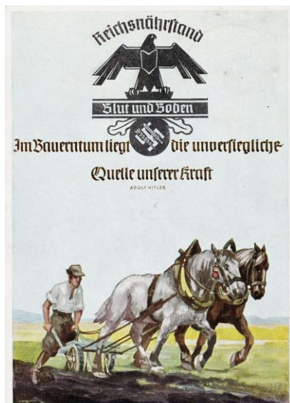
A német paraszt idealizált ábrázolása egy Birodalmi Élelmezési Rend-i plakáton. 53