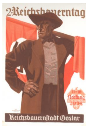
A Birodalmi Élelmezési Rend (Reichsnährstand) jelképe. 49 Birodalmi Parasztság Napja rendezvény egyik plakátja. 50