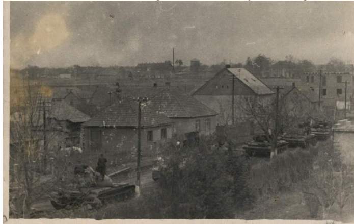
A beregszászi Macsolai utcán haladnak át a tankok a forradalom leverésére. A fotót készítette: Balázsi László beregszászi lakos 1956 októberében

A lakosság számára érthetetlen volt az is, hogy amikor a rádió bejelentette, hogy megkezdődött a szovjet csapatok kivonása Magyarországról, Beregszászon nem csökkent a Magyarország felé tartó tankok áradata, visszafelé pedig egyetlen tank sem haladt át a városon. Miattuk a forgalom szinte teljesen megbénult. 6