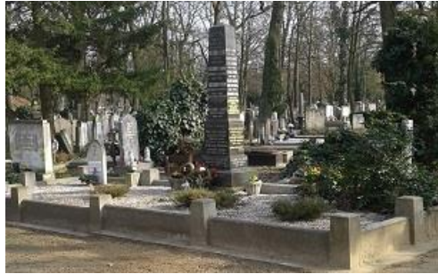
8. kép. A Koszorús család márványoszlopos síremléke a Debreceni Köztemetőben

A Debreceni Református Kollégiumban két éve készítettek egy dicsőségtáblát, amelyre fölírták az iskola 100 leghíresebb diákjának nevét. Mivel többen lemaradtak róla, célszerű és időszerű, mi több illő volna egy másik táblát is tervezni, ahová az újabb száz híres diák neve kerülhetne föl. Közéjük érdemes volna Koszorús Ferenc vezérkari ezredes, posztumusz vezérezredes nevét is fölírni, mert ennél magasabb tisztség a Magyar Honvédség rangsorában nincs. 2014. július 3-án a honvédelmi miniszter által adományozható legmagasabb kitüntetést, a Hazáért érdemjelet is megkapta, melyet a családja vehetett át. A Debreceni Kollégium diákjának, az immár legmagasabb rangú magyar honvédtisztnek méltán emeltek szobrot Budapesten! 31