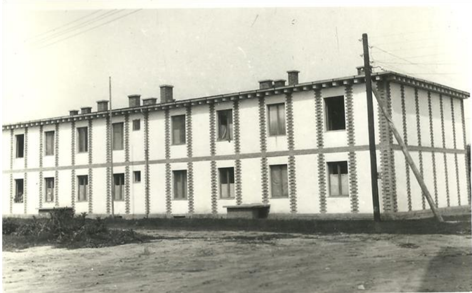
1. kép: Hadházi utcai házak