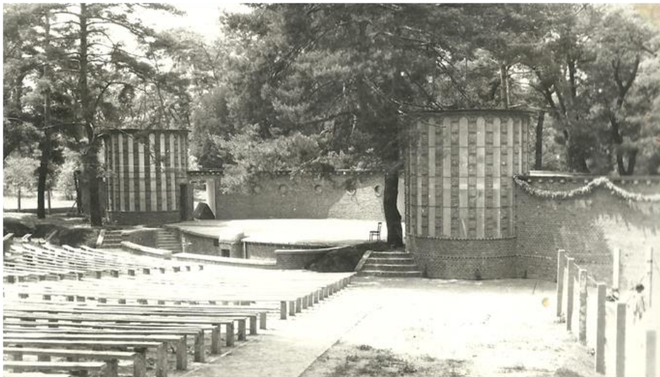
2. kép: Szabadtéri színház