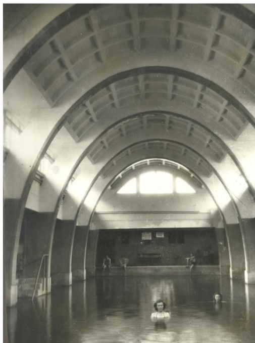
3. kép: Gyógyfürdő