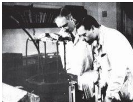
A ködkamra-felvétel készítői: Szalay Sándor és Csikai Gyula