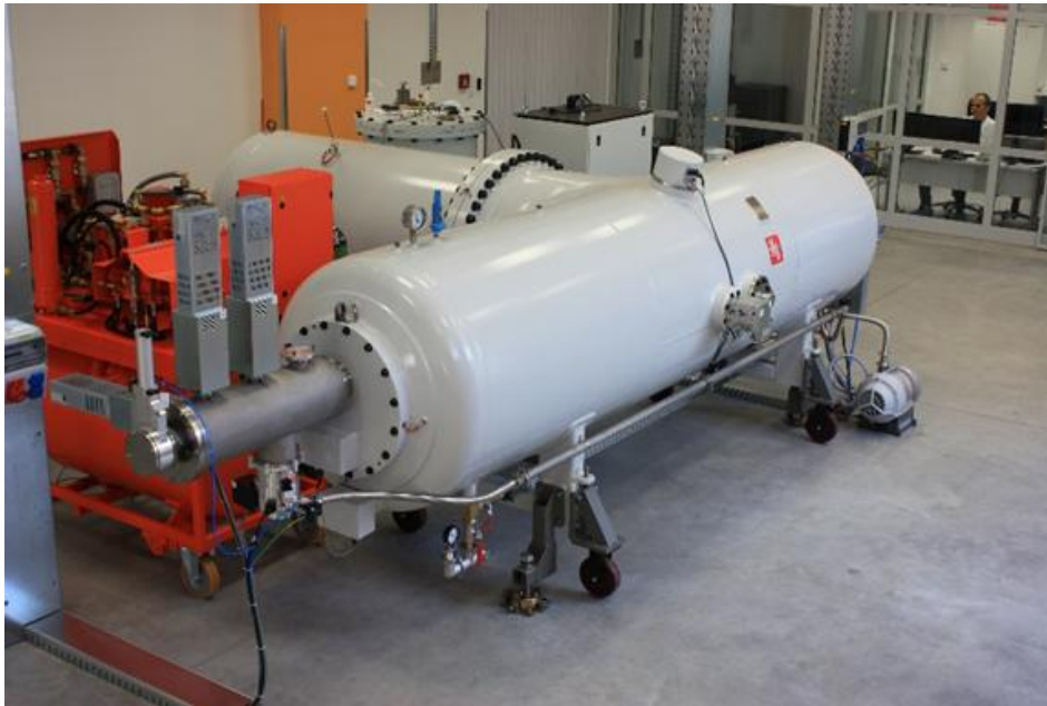
A jövő: az új Tandetron gyorsító

A távolabbi jövő feladatai jelenleg még csak a gondolkodás szintjén fogalmazódnak meg. Elvi lehetőségként jelentkezik például egy nagyobb energiájú, az alapkutatások mellett a proton- és ionterápiában is használható gyorsító berendezés létrehozása. Mindenesetre leszögezhető, hogy a jövő kutatási tematikájának alakításában az Intézet – ahogy eddig is tette – a fizika és alkalmazási területei nemzetközi fejlődési irányainak figyelembevételével fog eljárni, hiszen így válik lehetővé, hogy megtarthassa a fizikai alap- és alkalmazott kutatások területén elfoglalt jelenlegi helyét és szerepét.