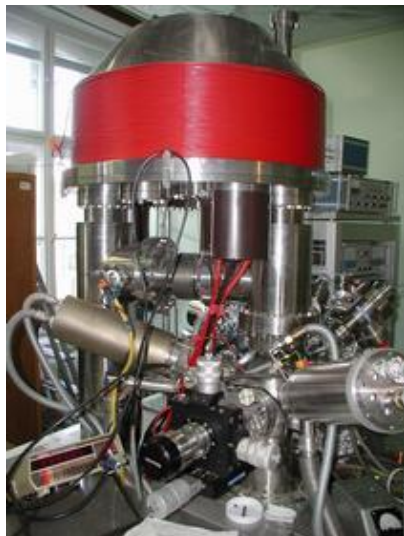
Az anyagtudományokat szolgáló ESA-31 elektron spektrométer