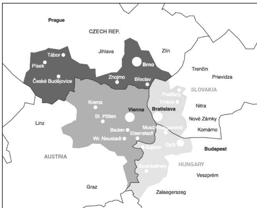
5. ábra: A Centrope region elhelyezkedése

A különböző megújult határközi együttműködések és intézményi struktúrák, inter-regionális szervezetek minden problémájuk ellenére a határon átvélő kapcsolatok olyan új intézményesült keretei, amelyek eredményesen szolgálhatják az uniós források megszerzését, hatékonyabb felhasználását, mindenekelőtt pedig a közvetlen kapcsolatok és helyi erőforrások kiaknázásában rejlő lehetőségeket, amelyek mérsékelhetik a Magyarország Európai Unió és schengeni csatlakozásával létrejött külső határok kedvezőtlen hatásait. A határon átnyúló kapcsolatokban bekövetkező, egyre nyilvánvalóbb paradigmaváltás nyomán, Magyarország és mindenekelőtt a belső államhatárok mellett elhelyezkedő szomszédai esetében a határrégiók és a határon átnyúló együttműködések hatékonyabban segíthetik elő a határrégiók közötti összekötő (híd-) szerep megszilárdulását, hajdanvolt integrációs kapcsolatok újjászerveződését, a Trianon folytán széttöredezett térszerkezeti egységek újraegyesítését , optimális esetben pedig távlatosan egy új Kárpát-medencei transznacionális makroregionális gazdasági térség létrejöttét, erősítve Kárpát-medence gazdasági-társadalmi kohézióját .