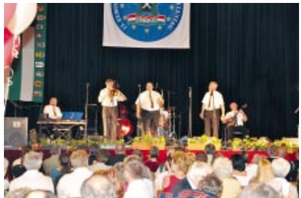
A Benkó Dixieland Band koncertje