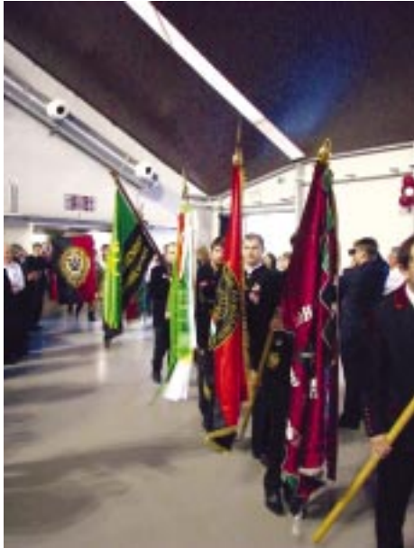
A zászlók bevonulása