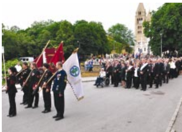
Indulnak a kohászok