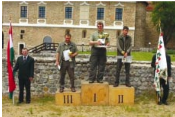
„Az év erdésze” verseny eredményhirdetése