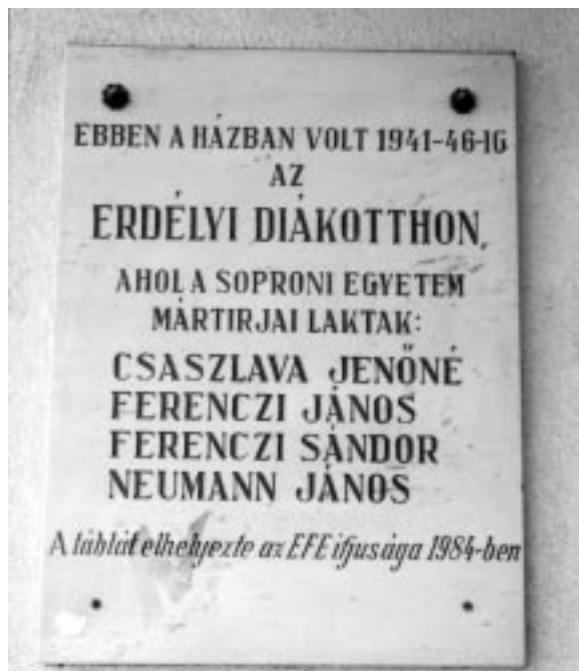
Emléktábla a Mátyás király u. 5. sz. ház falán

Az 1989. évi politikai változások frissítő szele elsodorta, visszavonulásra készítette a „tiltó – tűró – támogató” megszorító sablonjának képviselőit is. 1990. március 30-án az egyetemi hallgatók Selmeci Társasága és az akkortájt alakult Soproni Erdélyi Kör együttműködésével felavatták az öt éve elkészült emléktáblát az eredeti fel-