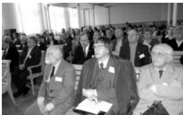
A plenáris ülés hallgatósága