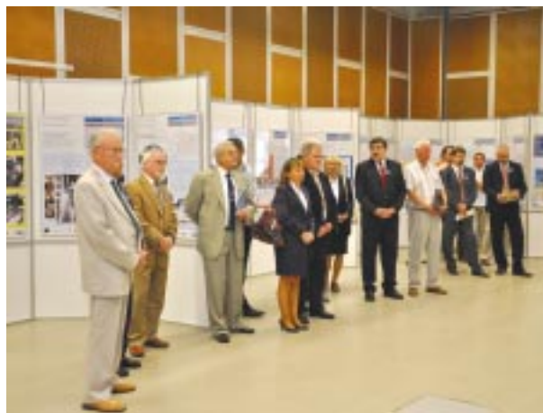
A kiállítások megnyitója