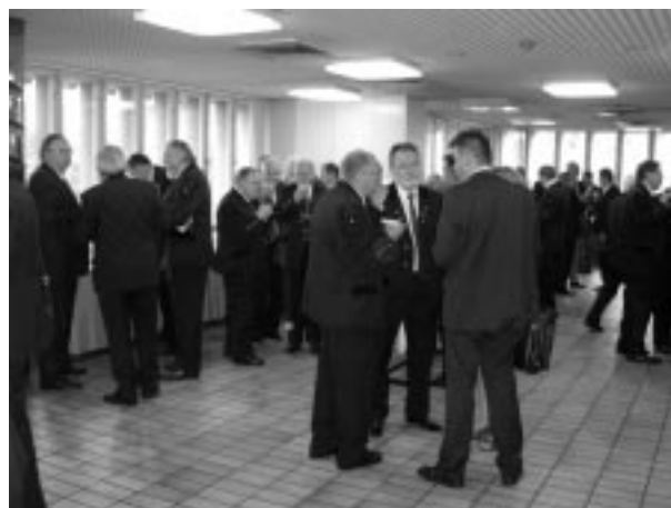
A szavazatok leadása után a szünetben

A vezetőségválasztás megtörténte előtt a küldöttek nyílt szavazással egyhangúlag megerősítették a helyi szervezetek által az OMBKE küldöttgyűlésére delegáltak névsorát.