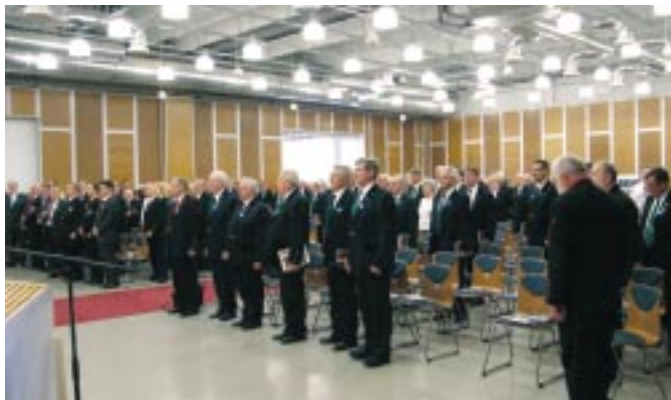
Az OMBKE 99. Küldöttgyűlése. A küldöttek a Bányászhimnuszot éneklik