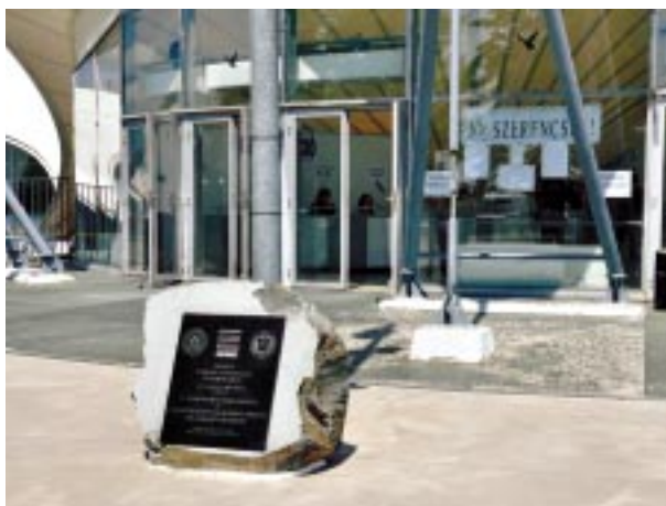
A Találkozó helyszíne a pécsi Expo Center, előtte a Találkozó emlékköve