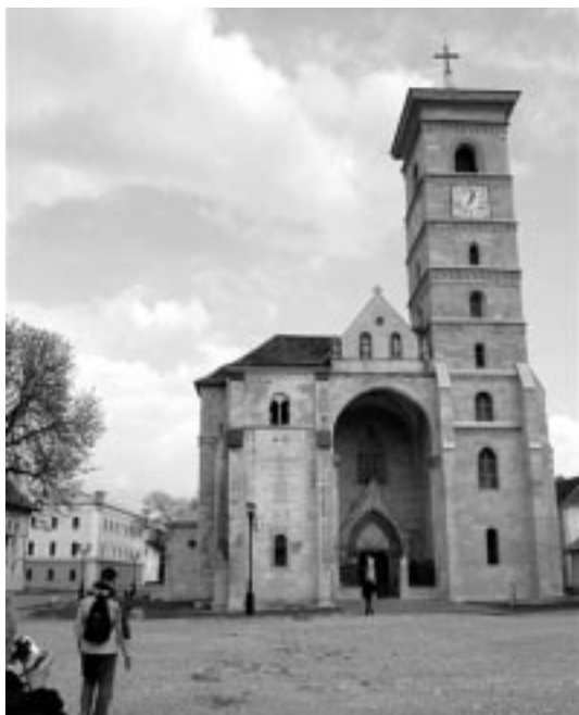
A Szt. Mihály-székesegyház

Az Erdélyi Fejedelemség egykori virágzó fővárosát külön kiránduláson, az ún. „hölgyprogram” keretében látogattuk meg. Bethlen Gábor itt alapította meg 1622-ben azt a tekintélyes református kollégiumot, amelyet később a török betörések elől Apafi Mihály Nagyenyre költöztetett. A vár bejáratánál az 1922-ben épült, hatalmas, bizánci stílusú ortodox székesegyház szinte eltakarja Erdély egyik legnagyobb építményét, a román kori magyar építőművészet egyik remekét, a Szent Mihály-székesegyházat, melyben láthattuk Hunyadi János , Hunyadi László , János Zsigmond , Fráter György és Márton Áron síremlékeit.