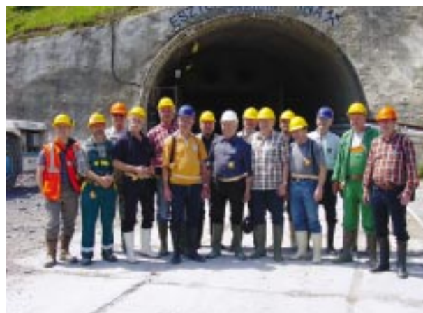
Szakmai kirándulás Bátaapátiba