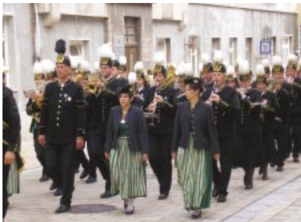
Érkezés a Széchenyi térre (Bad Ischl delegációja)