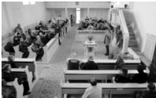
A felvinci református templomban

A 2000-ben végzett felújítási munkálatok során „italo-bizánci” stílusú freskórészeket kerültek elő, melyek korát a szakemberek Károly Róbert uralkodásának elejére, vagyis a 14. sz. első két évtizedére teszik. Feltételezik, hogy a kép megrendelője a helybéli szabad székely közösség volt. A falfestmény