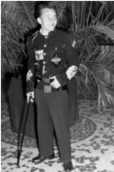
2. kép: Balekcsősz díszben

voltak már „relatív újdonságok” a vidám hangulatú ceremónia során; nem hiszem, hogy azóta is előfordult volna, hogy a Valétaelnök számárkordés díszmenettel adta az érdeklődők tudtára a nagy eseményt (3. kép). Az olykor makrancoskodó hóféhér színű számár vezetése és a szükség szerinti „kordétolás” már minket – a búcsúztatókat – illetett.