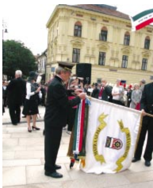
Zászlószalagok felkötése (Arno Jäger)