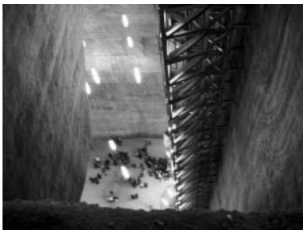
Csoportunk a Rudolf-aknában

A Torda városának északkeleti részén kezdődő, a legrégebb idők óta ismert sótelep 45 négyzetkilométeren terül el, vastagsága átlag 250 m, de a gyűrődés központi részén gyakran meghaladja az 1200 m-t. A só kitermelése felszíni kamrák formájában már a rómaiak idején megkezdődött. A bányászatot igazoló dokumentumok 1271-re vezethetők vissza, amikor hivatalosan is létrehozták a sókamrát. A ma is létező sóbányát 1690-ben nyitották meg; a sót először harang formájú nagytermekben, majd 1850 után trapéz alakú fejtésekben termelték ki. A bányában 1932-ben állt le a munka, ma már csak turisztikai látvánival és gyógyhely. A nagyközönség számára a kilencvenes évek elején nyitották meg. Mivel a bánya Erdély egyik legnagyobb turista látványossága, ezért a közelmúltban modern bejáratot és fogadó épületet alakítottak ki.