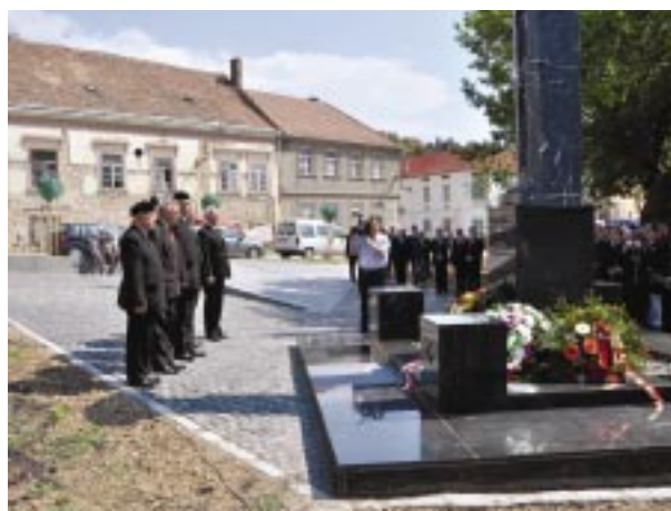
Koszorúzás az Ágoston téren