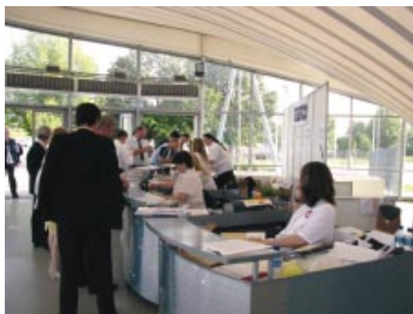
Munkában a recepció