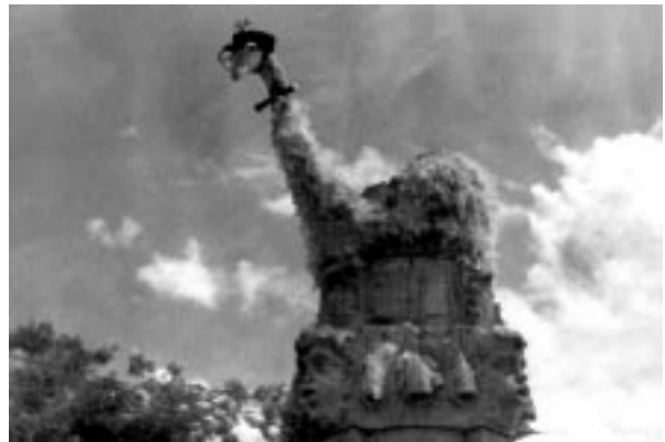
1. kép: A „Tollashattyú”

A hagyományok természetesen fejlődnek és alkalmazkodnak az adott időszak környezeti elvárásaihoz is. Így az „eredeti” selmeci hagyományoknak is volt már „újítása” Sopronban is. Amikor évfolyamunk megérkezett Sopronba, természetesen sor került a „balekavatásunkra” – és ezt már egy helyi hagyománnyal fűszerezett „hattyú-tollazással” is megtoldottuk (1. kép). A