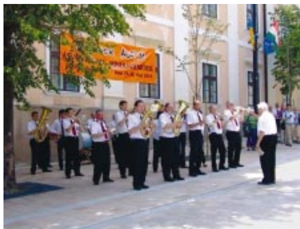
Térzene a Széchenyi téren (Salgótarjáni Kohász Fúvószenekar)