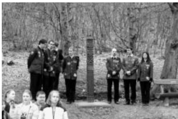
Emlékkopjafa a Kovácsároknál (későbbi felvétel)

Gondos előkészítés és tanácsi engedélyeztetés után 1984 októberében emléktáblát helyeztek el a Diákotthon Mátyás király u. 5. számú ház falán is. A meghívókat is szétküldték, de a tervezett leleplezés napján