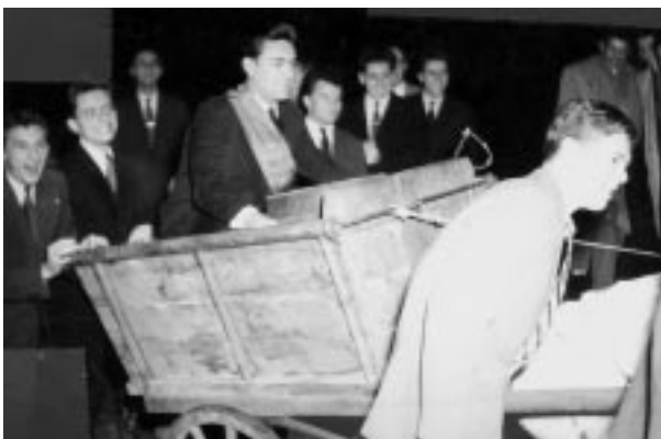
3. kép: Valétaelnök kordén