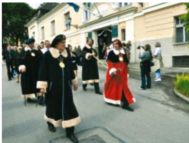
A Cseh Pribram Bányászok és Kohászok Egyesület tagjai hagyományos díszben