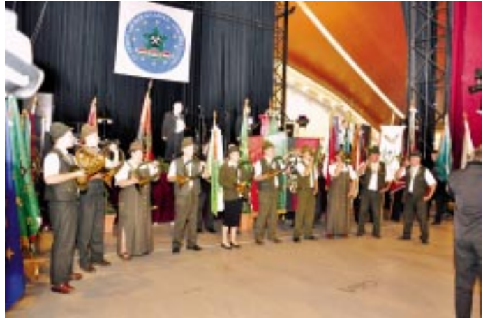
Megnyítő fanfár (Baranya Vadászkürt Egyesület)