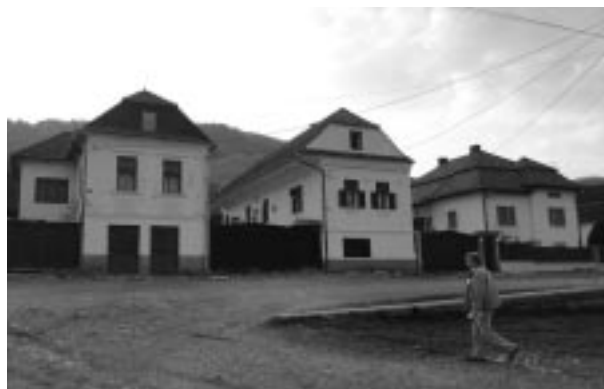
Torockó műemlék házai

Sokak szerint egész Erdély legszebb falva, mind természeti fekvését, mind építészetét illetően. Megközelítése azonban az igen elhanyagolt, kátyúkkal teli úton nagy megpróbáltatásnak teszi ki a gépkocsi vezetőjét. Torockó elzártsága meghatározó volt abban, hogy kora-újkori fogantatású, a vasparhoz kötődő, egyedi kultúráját viszonylag érintetlenül meg tudta őrizni. Mindennek alapját természeti környezete, elsősorban a középkorban és az újkor elején gazdaságosnak mondható vasértelepei képezték. A falu régi gazdagságát annak köszönhette, hogy az Árpád-házi királyok idején idetelepített német vasművesek meghonosították a vasfeldolgozást és a települést az erdélyi vasgyártás központjává tették, melynek első írásos emlékei a 16. századból valók. A vasércbányászat valószínűleg – mint a középkorban általában – elsősorban az arany- és ezüstabányászat kísérőjeként jelentkezett, hiszen itt is termeltek aranyat és ezüstöt a 18. sz. végéig. Ekkor még aranyváltó is működött a helységben.