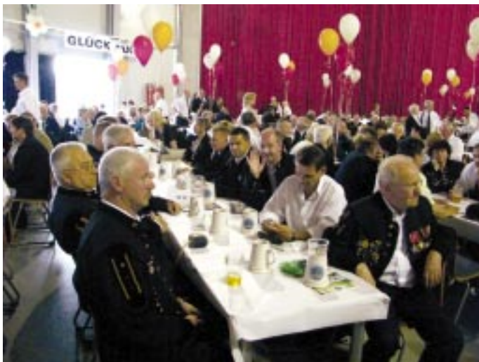
A megnyítő résztvevőknek egy része