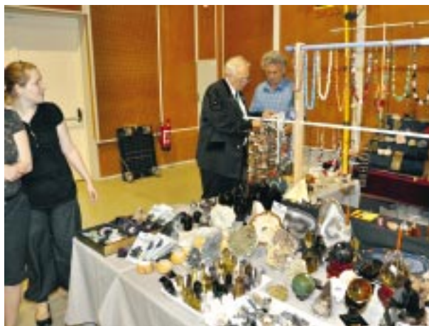
Ásványbörze és kiállítás