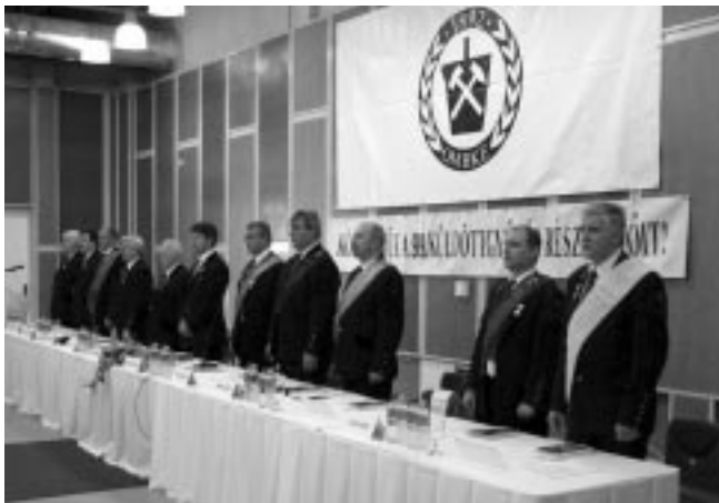
A Küldöttgyűlés elnöksége