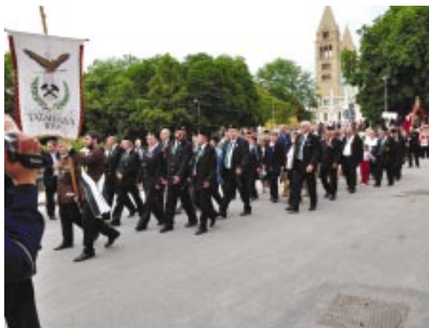
Tatabányai bányászok a menetben