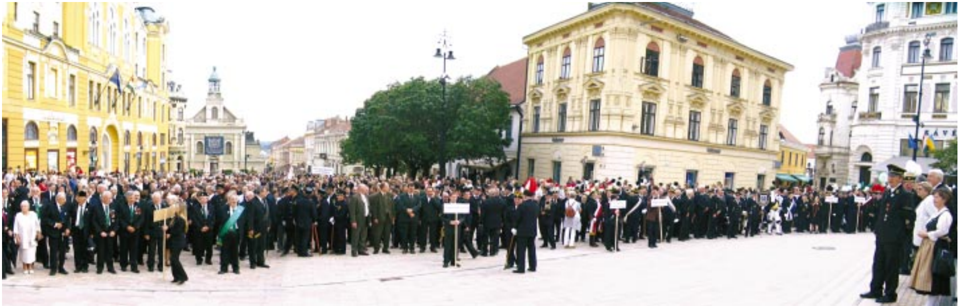
A díszfelvonulás résztvevői a Széchenyi téren