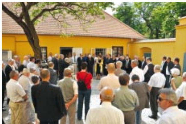
„A mecseki bányászat története” kiállítás megnyitója