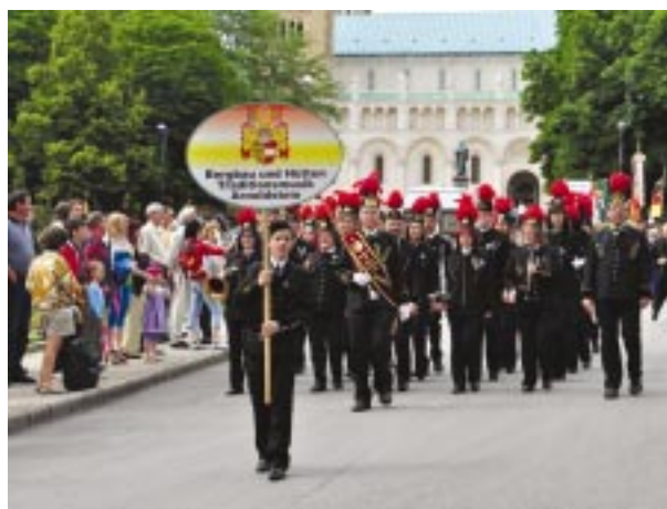
Indul az arnoldsteini bányász-kohász zenekar