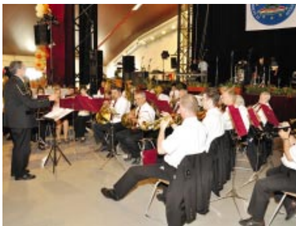
Fúvós koncert az Expo Centerben (Perecesi Bányász Fúvószenekar)