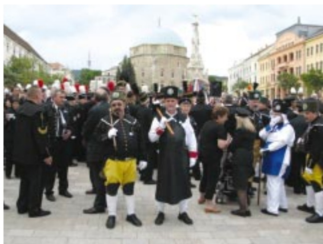
Külföldi bányászok díszben