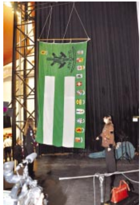
Az Európai Bányász Szövetség zászlajának felvonása