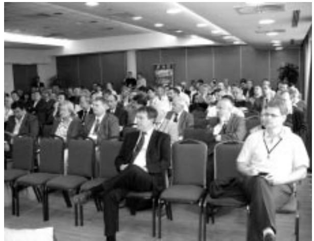
A konferencia hallgatósága Zalakaroson