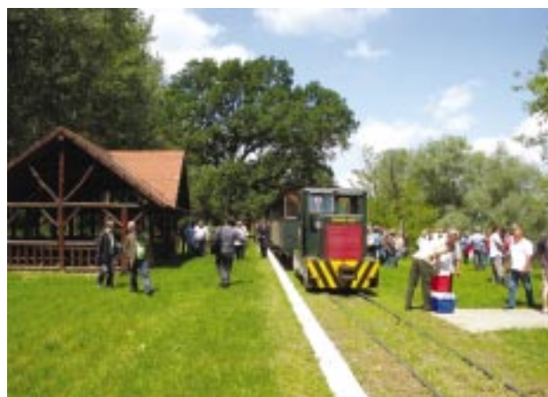
Szakmai kirándulás a Gemencre