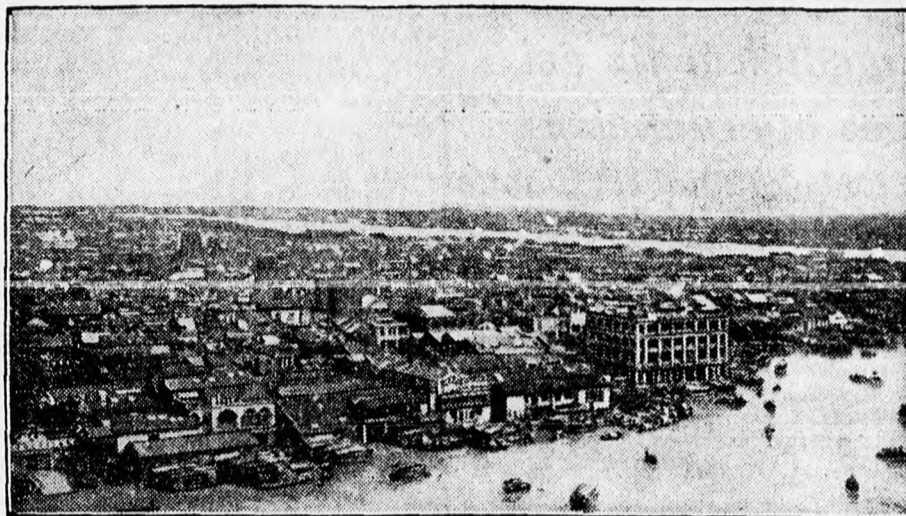
Kanton városa, amelyért most új harc folyik

Az ágyunaszádok parancsnoka nem teljesítette a ki-