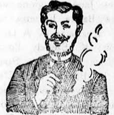
Egger-mellpasztilla csak hamar meggyógyított!

kapható gyógyszer-tárakban és drogeriákban.