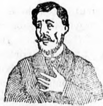
Megfojt ez az átkozott köhögés

és elnyálkásodás ellen gyors és biztos hatásúak