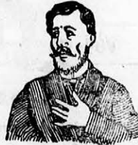
Megfojt ez az átkozott köhögés

és elnyájkasodás ellen gyors és biztos hatásúak