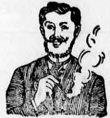
Egger-mellpasztilla csak hamar meggyógyított!

kapható gyógyszerárakban és drogeriákban.